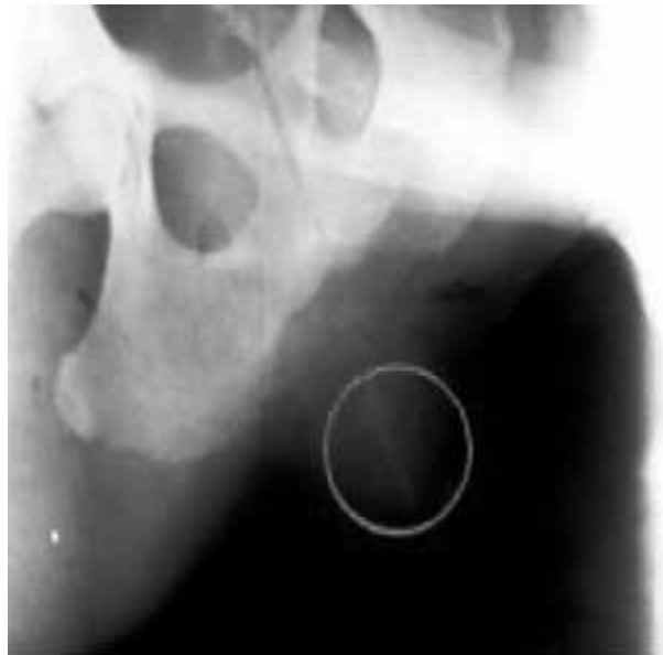
Figura 2. Radiografía, proyección ventrodorsal. En el interior del círculo se observa estructura radioopaca compatible con os clitoris .

General view of external genitalia. Hypertrophied clitoris protruding from the labia.