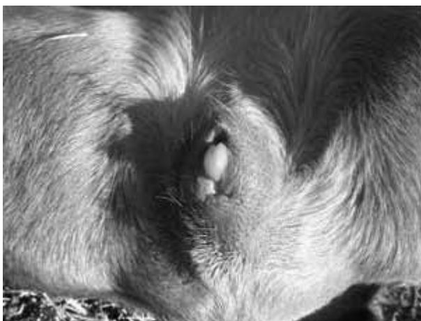
Figura 1. Vista general de genitales externos. Clítoris hipertrofiado protruyendo de los labios vulvares.

En el examen clínico se observa hipoplasia vulvar y un clítoris en forma de dedo que mide 3 cm de largo y sobresale de los límites de la vulva (figura 1). La radiografía (figura 2) permite apreciar en la zona perineal una formación radio-opaca compatible con un os clitoris , análogo al os penis en los machos. Se realizó la comparación con las medidas esperadas para la raza, se observó que estaba por encima del promedio en altura, peso y desarrollo muscular. La medición de testosterona antes y después de la estimulación con hCG dio valores basales. Los órganos andrógeno-dependientes se masculinizan