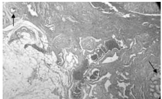
Figura 6. Corte histopatológico de ovotestis derecho. Nótese el tejido ovárico en el borde superior izquierdo (flecha) y el tejido testicular en el borde inferior derecho (flecha). 400x.

Hystopathological section of right ovotestis. Note the ovarian tissue in the top left corner (arrow) and testicular tissue in the bottom right corner (arrow). 400x.