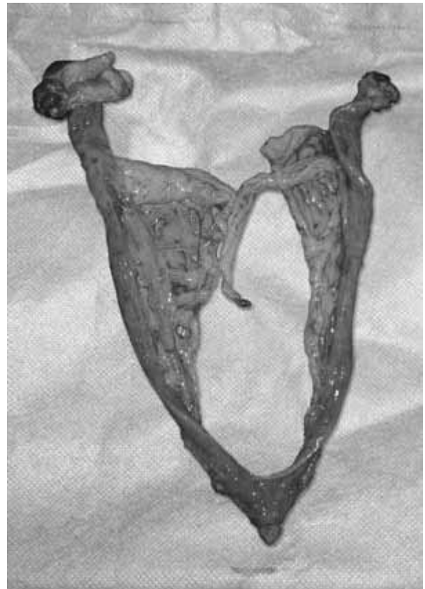
Figura 5. Vista macroscópica de las gónadas y útero bicornual. Macroscopic view of gonads and bicornuate uterus.

Se aprecia un individuo en donde el sexo cromosómico es femenino y el sexo gonadal presenta tejido histológico femenino y masculino, con presencia de una anomalía en sus genitales externos. Este agrandamiento del clítoris fue descrito en varios casos de intersexo en caninos (Chaffaux y Cribiu 1991, Sommer y Meyers-Wallen 1991, Melniczek y col 1999, Kuiper y Distl 2004, Nowacka y col 2005, Kim y Kim 2006). Los derivados de los conductos müllerianos se desarrollan normalmente, formando los oviductos, el útero