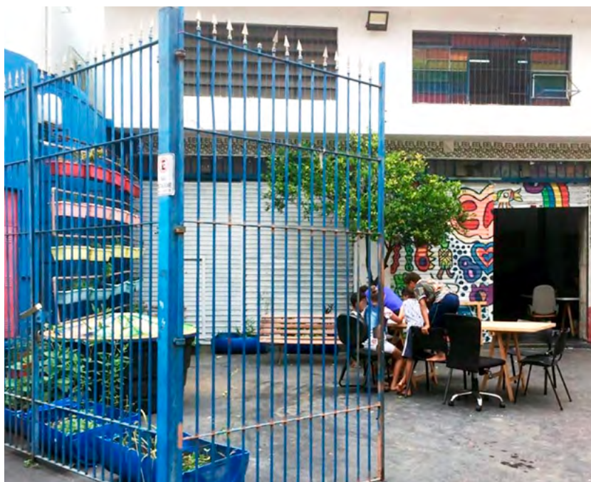
1 Grupo de niños dibujando en el patio central del Galpão con las puertas abiertas, como siempre. / Group of children drawing in the Galpão's courtyard with gates open, as usual.

La agenda de vivienda del movimiento LGBTQ+ brasileño no es nueva y siempre ha existido una fuerte demanda de los más jóvenes. Sin embargo, esto no ha sido atendido principalmente por falta de fondos. En los últimos años han surgido algunas iniciativas y políticas públicas para abordar el problema 2 , las que han servido para descubrir la vulnerabilidad de estos jóvenes, demostrando que necesitan una extensa red de apoyo y que sus necesidades no se abordan adecuadamente en las políticas de protección y vivienda social. En este contexto, Casa 1 se destaca como una iniciativa que va más allá de proporcionar refugio, brindando apoyo cualitativo centrado en necesidades específicas 3 . Aunque no fue el primer proyecto de