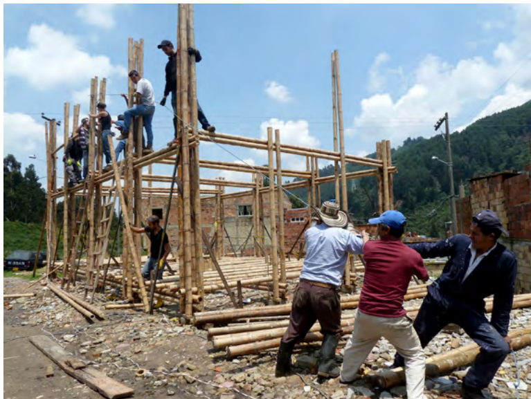
8 Arquitectura Expandida, La casa de la lluvia [de ideas] , un espacio comunitario para cultura y medioambiente. Barrio La Cecilia, distrito de San Cristóbal, Bogotá D.C. Proceso de autoconstrucción, 2012-presente. / The House of the Rain [of ideas], a cultural and environmental community space. La Cecilia neighborhood, San Cristóbal District, Bogotá D.C. Self-building process. 2012-ongoing.

HS: Mientras la Segunda Guerra Mundial estaba en auge, los planificadores urbanos pensaban esforzadamente, anticipándose a cambios radicales en la forma en que