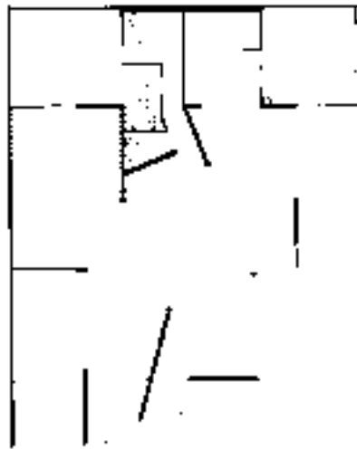
Planta primer piso