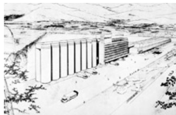
Complejo Industrial Carozzi (Construido), 1961. Perspectiva.

+Info: Pedro Ignacio Alonso, coordinador Archivo de Originales CID Sergio Larraín García-Moreno, cid-slgm@puc.cl / palonsoz@puc.cl, tel. (56 2)686-5584 / 09-8941096