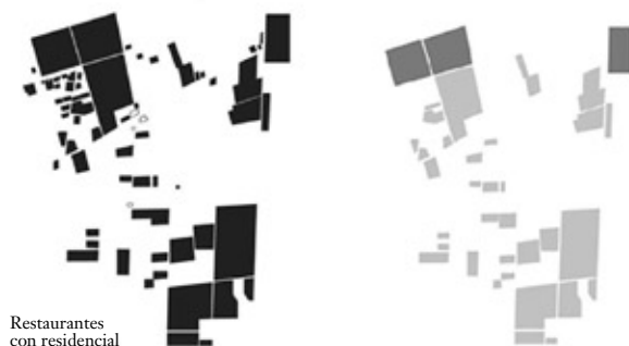
Restaurantes con residencial