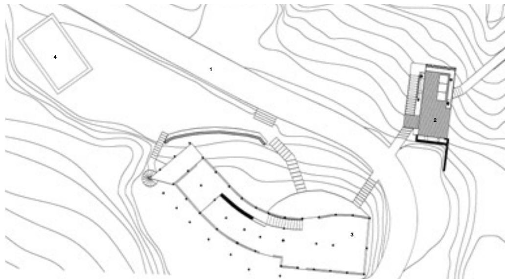
Plano de emplazamiento 0 2 m