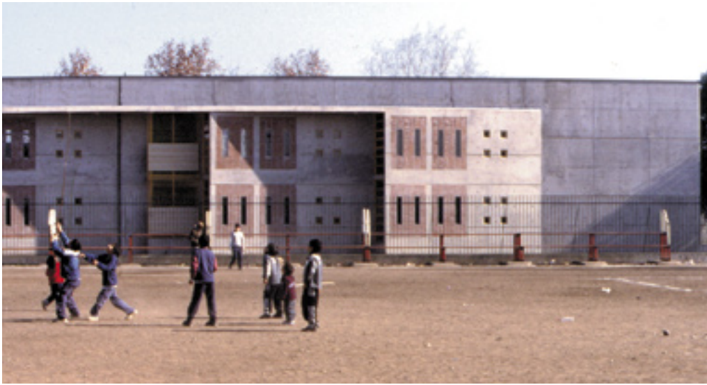
5 Fachada oriente desde canchas