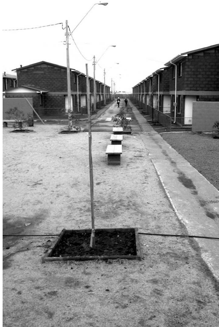
01 Loteo de vivienda social, La Capilla, Puente Alto.

The actual prestige of the private sector, the politically correct but devalued public sector, and the absence of shades in the distinctions between both makes the definition of a code urgent that will ensure the continuity of public spaces in the city. Bernardo Secchi has said that public space is where "one is in public." Do the ordinances reflect this?