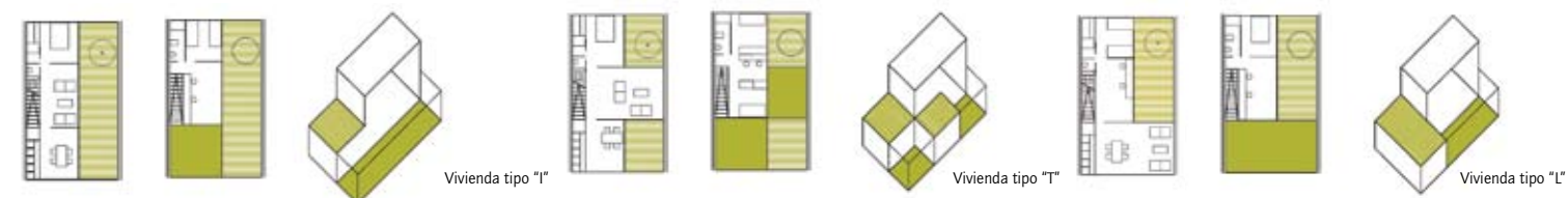
Landstrip patio houses

El parque es la infraestructura en la que se