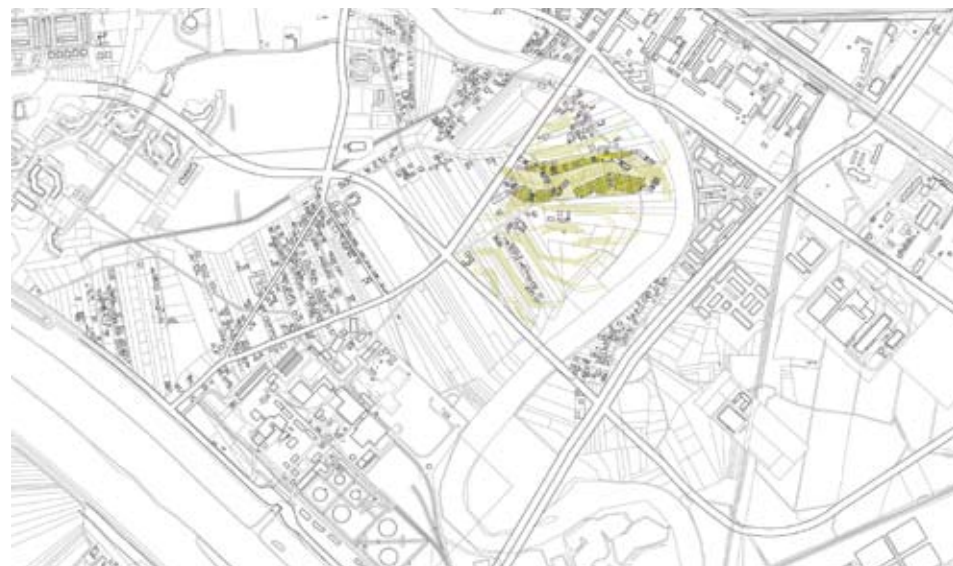
Landstrip. Propuesta general y su relación con el entorno inmediato

European es un concurso bianual destinado a promover el debate sobre la vivienda urbana y sus temas afines; se realiza desde el año 1989 y está dirigido a equipos de arquitectos europeos menores de 40 años. Los terrenos escogidos son propuestos por y para todo el continente y los miembros del jurado están compuestos también por arquitectos de diferentes países, permitiendo que sea uno de los concursos con mayor difusión internacional.