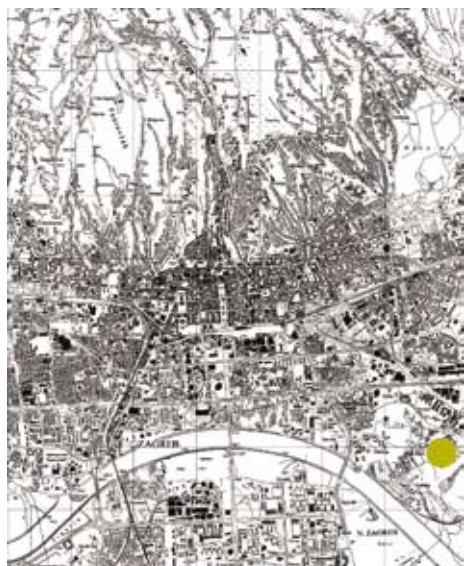
Zagreb, Croacia. Localización del sitio de intervención propuesto para el concurso