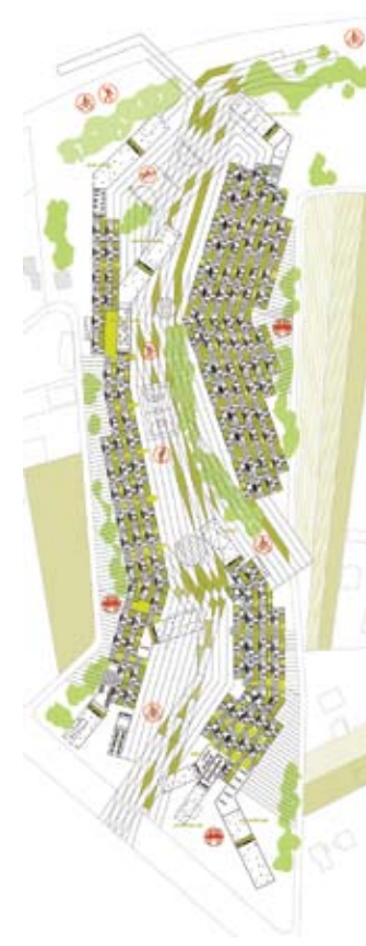
Vista general de los edificios de vivienda y el parque

Los sistemas de desarrollo propuestos permiten la emergencia de un nuevo paisaje urbano, reinterpretando las condiciones de partida del terreno. El parque garantiza la apertura visual característica del lugar mientras el crecimiento en franjas permite una escala asimilable a los campos de cultivo preexistentes y aldeaños, generando nuevas condiciones de vida.