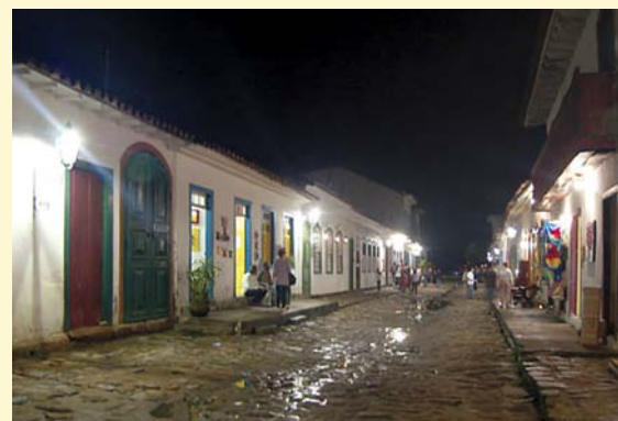
02 Proyecto de iluminación del centro histórico de Paraty, Río de Janeiro, Brasil