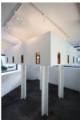
El museo en LIGA.