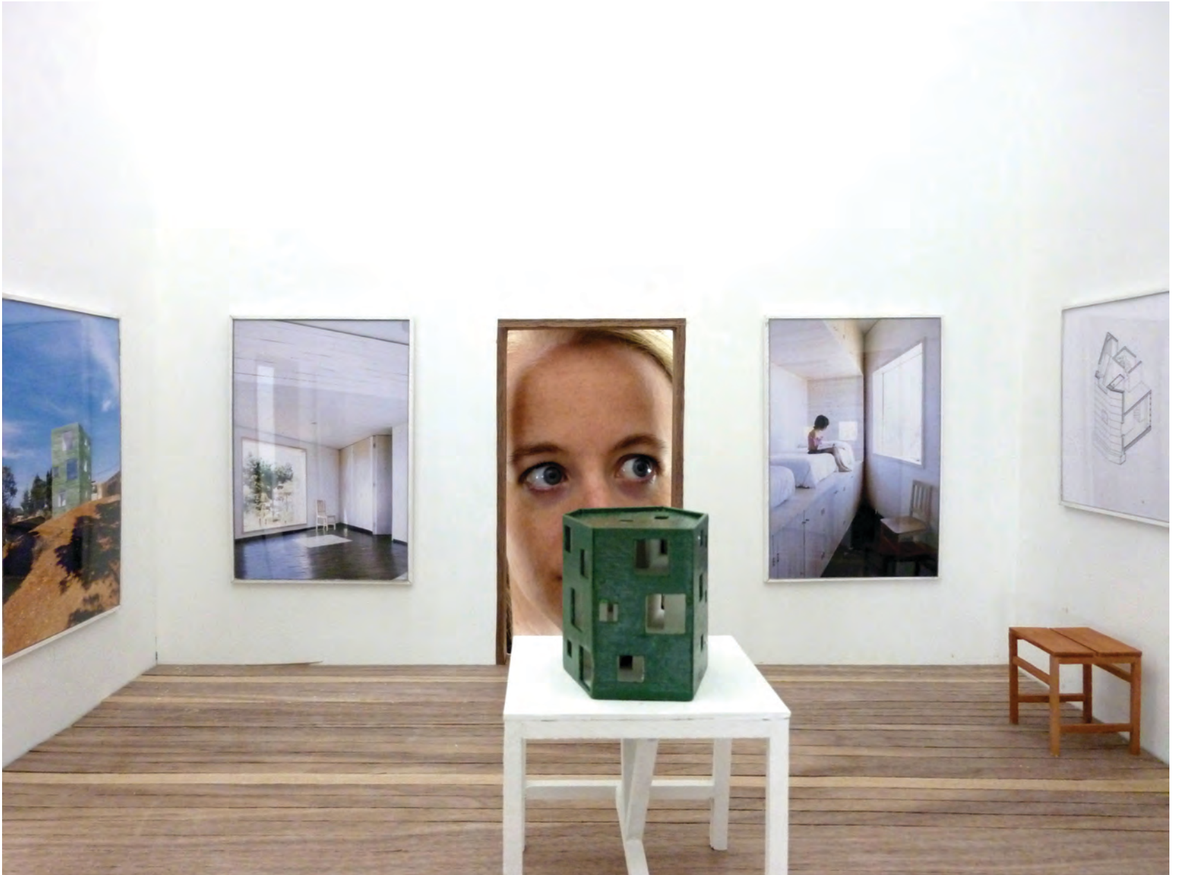
Sala para casa FOSC, San Pedro, 2009.

Una selección de doce obras construidas o en proceso de construcción resume el trabajo de 10 años del estudio chileno-argentino Pezo von Ellrichshausen. El montaje de estas obras se haría en un museo: especialmente proyectado para este propósito, se trata de una secuencia circular de doce salas organizadas alrededor de un patio central. A cada obra corresponde uno de estos recintos, donde se desplegarían un modelo a escala 1:20 y una serie de dibujos y fotografías en gran formato.