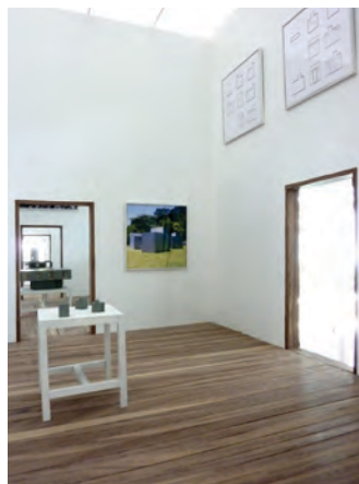
Primera sala esquina: pabellones XYZ, Concepción, 2001.