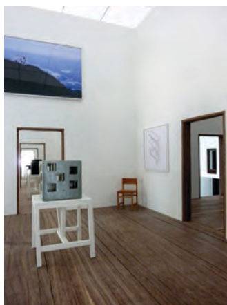
Tercera sala esquina: casa POLI, Coliumo, 2005.