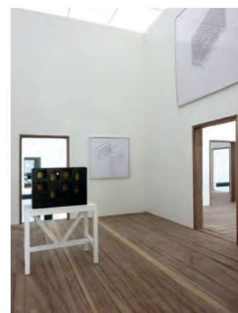
Sala para casa RIVO, Valdivia, 2003.