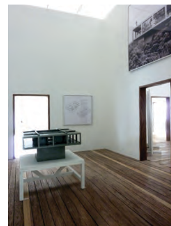
Sala para casa SOLO, Barcelona, 2012.