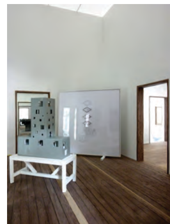
Cuarta sala esquina: casa CIEN, Concepción, 2010.