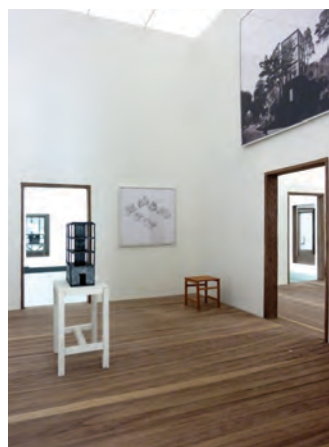
Sala para casa ARCO, Concepción, 2011.

Otras fotografías de Ni más ni menos están disponibles para los suscriptores arq en edicionesarq.cl