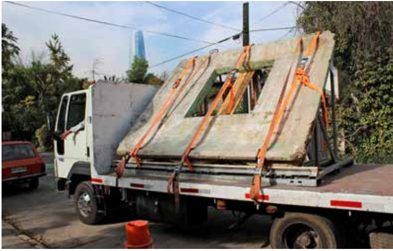
Llegada de panel desde puerto de San Antonio a Santiago, Chile, mayo de 2015. The panel arriving to Santiago from the port of San Antonio.