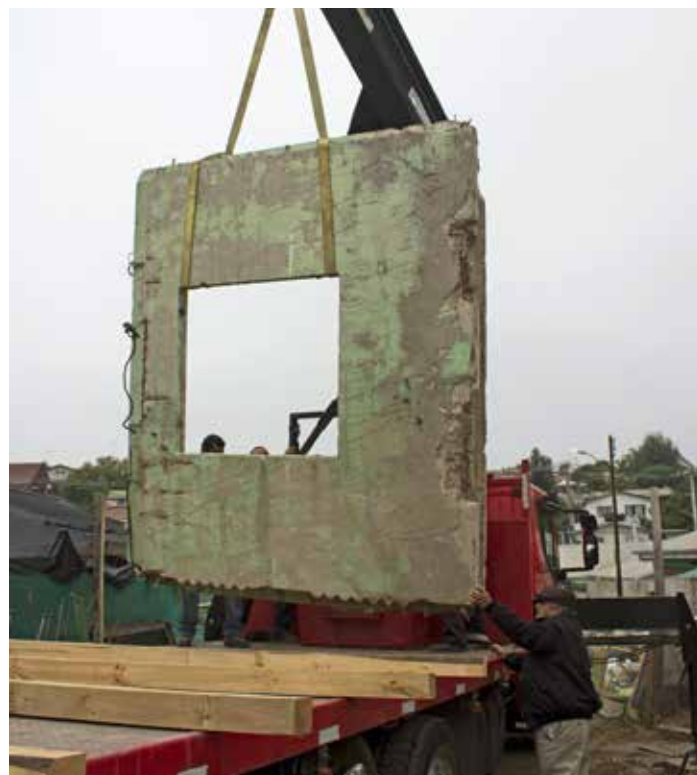
Salida de panel desde corral municipal de Quilpué hacia Santiago, Chile, 22 de diciembre de 2013. Panel leaving Quilpué's municipal junkyard towards Santiago.