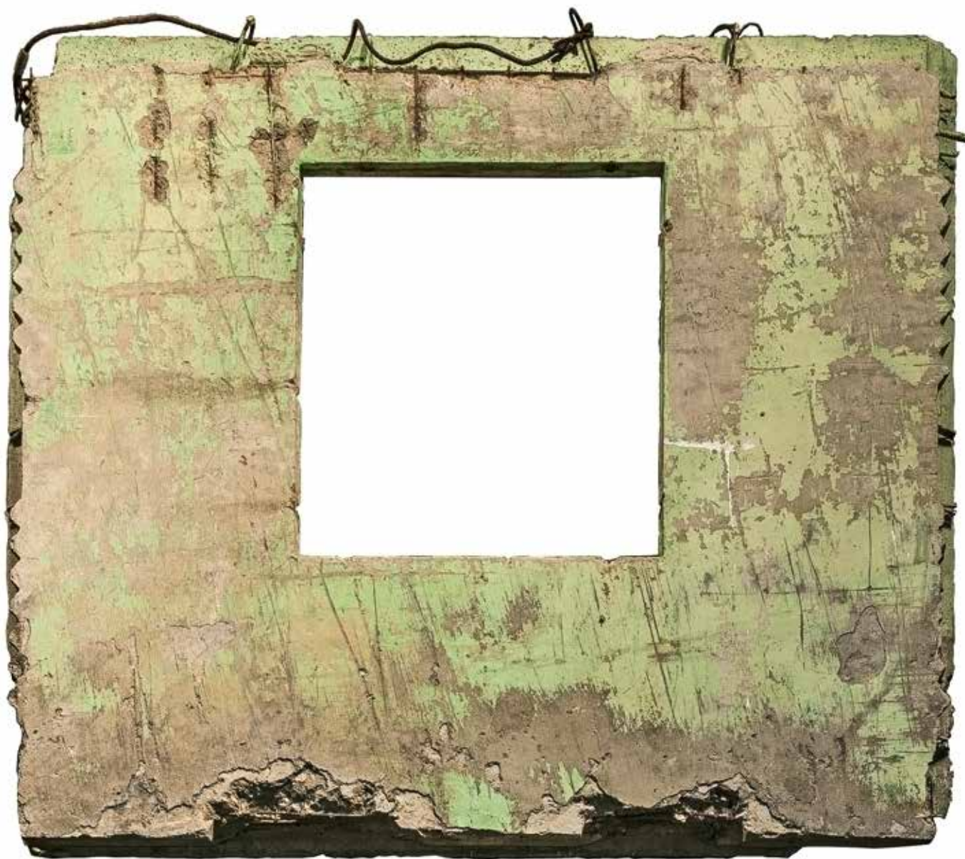
Panel conmemorativo antes de partir a Venecia, cara interna, enero de 2014. Panel before departing to Venice, inner face. © Omar Faúndez, Diseña

iniciada con el sistema francés Camus (1948), su posterior rediseño en la Unión Soviética como el sistema I-464 (1955), la donación de este a Cuba y su readaptación como el sistema Gran Panel Soviético (1963), y su posterior arribo a Chile, donde el sistema fue asimilado en dos etapas antagónicas de transformación del país: el proyecto socialista y el neoliberal, sistemas denominados КРД y ВЕР, respectivamente (Alonso y Palmarola, 2014b).