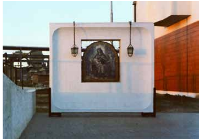
Panel intervenido con un retablo de Virgen María y el Niño Jesús, más dos lámparas neocoloniales. Quilpué, Chile, diciembre de 1974. Panel intervened with an altarpiece of the Virgin Mary and child, plus two neocolonial lamps.