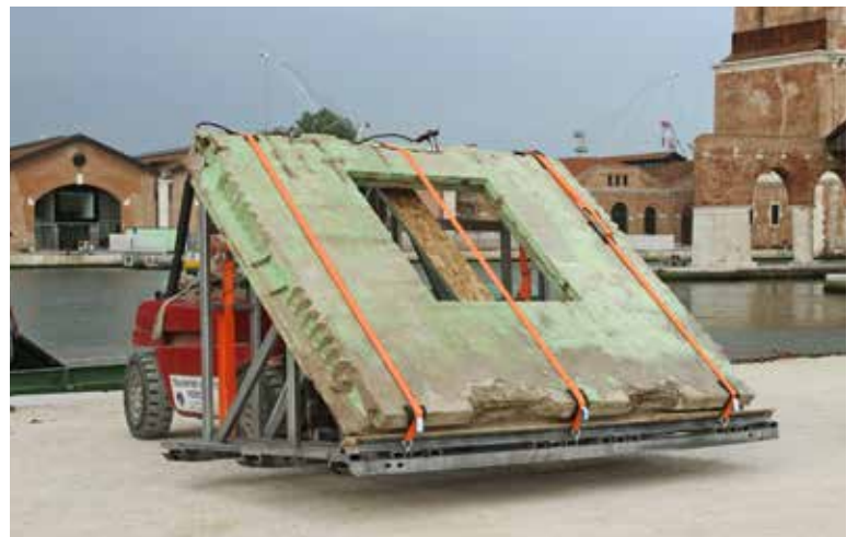
Llegada de panel desde puerto de Livorno hasta la Bienal de Venecia, Italia, 30 de mayo de 2014. Panel arriving from the port of Livorno to the Venice Biennale.