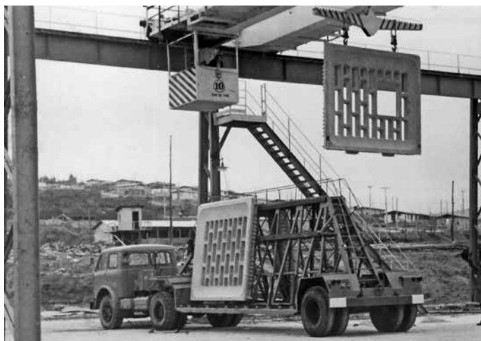
Salida de distintos modelos de paneles perforados, desde la fábrica en dirección a la obra. Quilpué, Chile, c. 1973. Models of perforated panels leaving the factory towards the construction site. Quilpué, Chile, c. 1973.