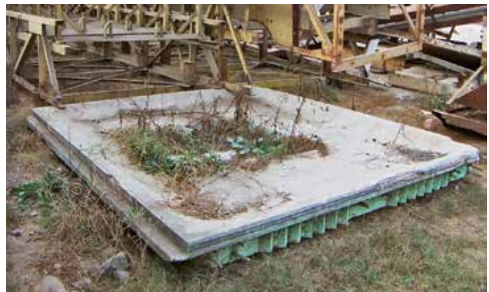
Panel en ruina y abandonado dentro de un botadero de chatarra industrial. Quilpué, Chile, 3 de junio de 2013. Panel ruined and abandoned in dump of industrial junk.