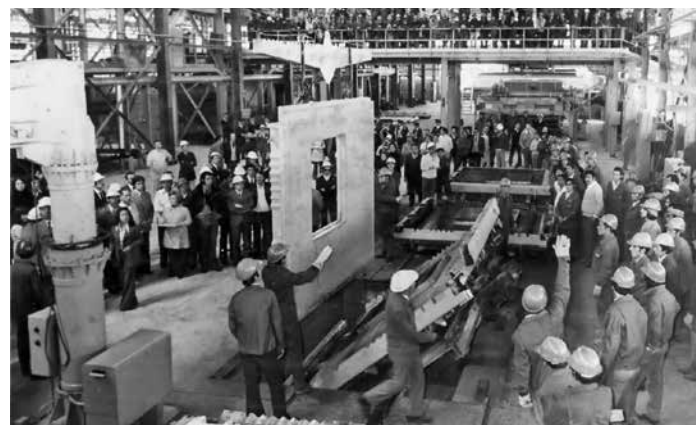
Evento en la fábrica КРД pocos meses después del golpe de Estado del 11 de septiembre de 1973. Producción de un modelo idéntico del panel conmemorativo, Quilpué, Chile. Event at the КРД factory a few months after the coup of September 11, 1973. Production of a model identical to the memorial panel, Quilpué, Chile.