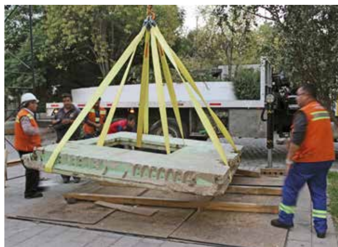
Salida de panel desde Santiago hacia puerto de San Antonio, Chile, marzo de 2014. Panel departing from Santiago towards the port of San Antonio.