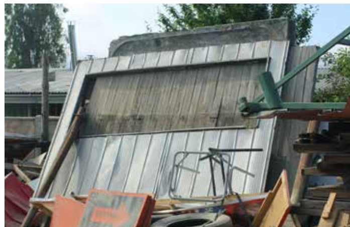
Panel cubierto por escombros en corral municipal, Quilpué, Chile, noviembre de 2013. Panel covered by debris at the municipal junkyard.