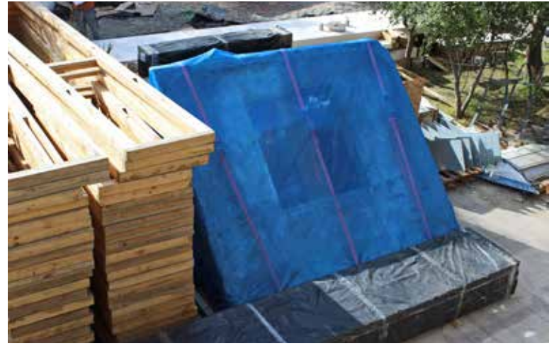
Panel almacenado en Campus Lo Contador, uc, Santiago, Chile, julio de 2015. Stored panel.