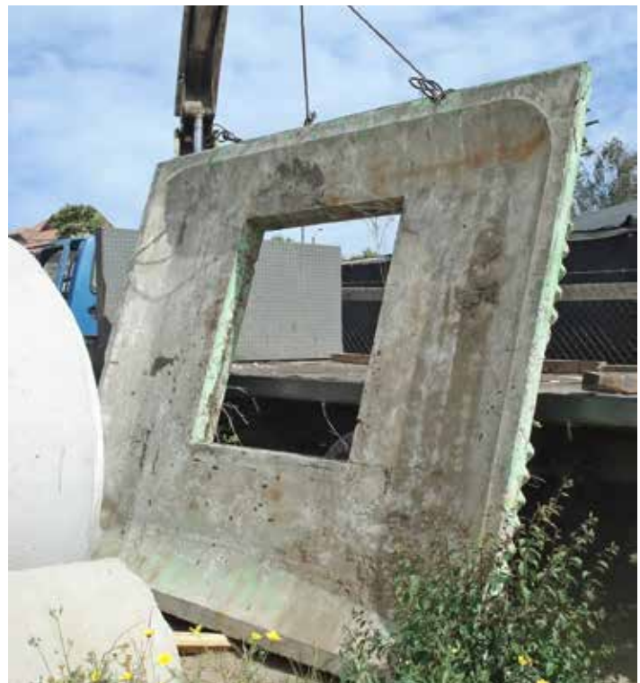
Salida de panel desde botadero de chatarra industrial hacia corral municipal, Quilpué, Chile, 12 de marzo de 2012. Panel leaving the dump of industrial junk towards the municipal junkyard