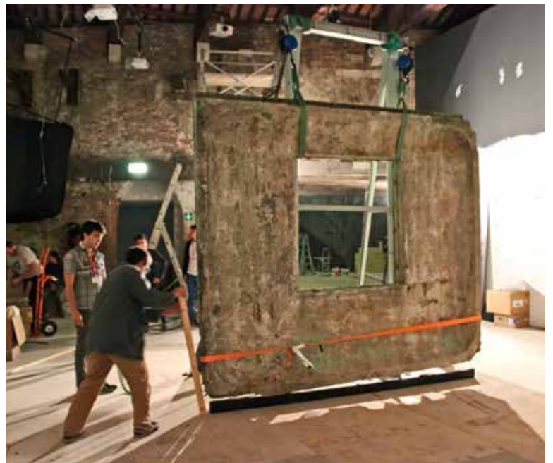
Instalación de panel en el Pabellón de Chile en la Bienal de Venecia, Italia, 30 de mayo de 2014. Installation of the panel in the Chilean Pavilion at the Venice Biennale.