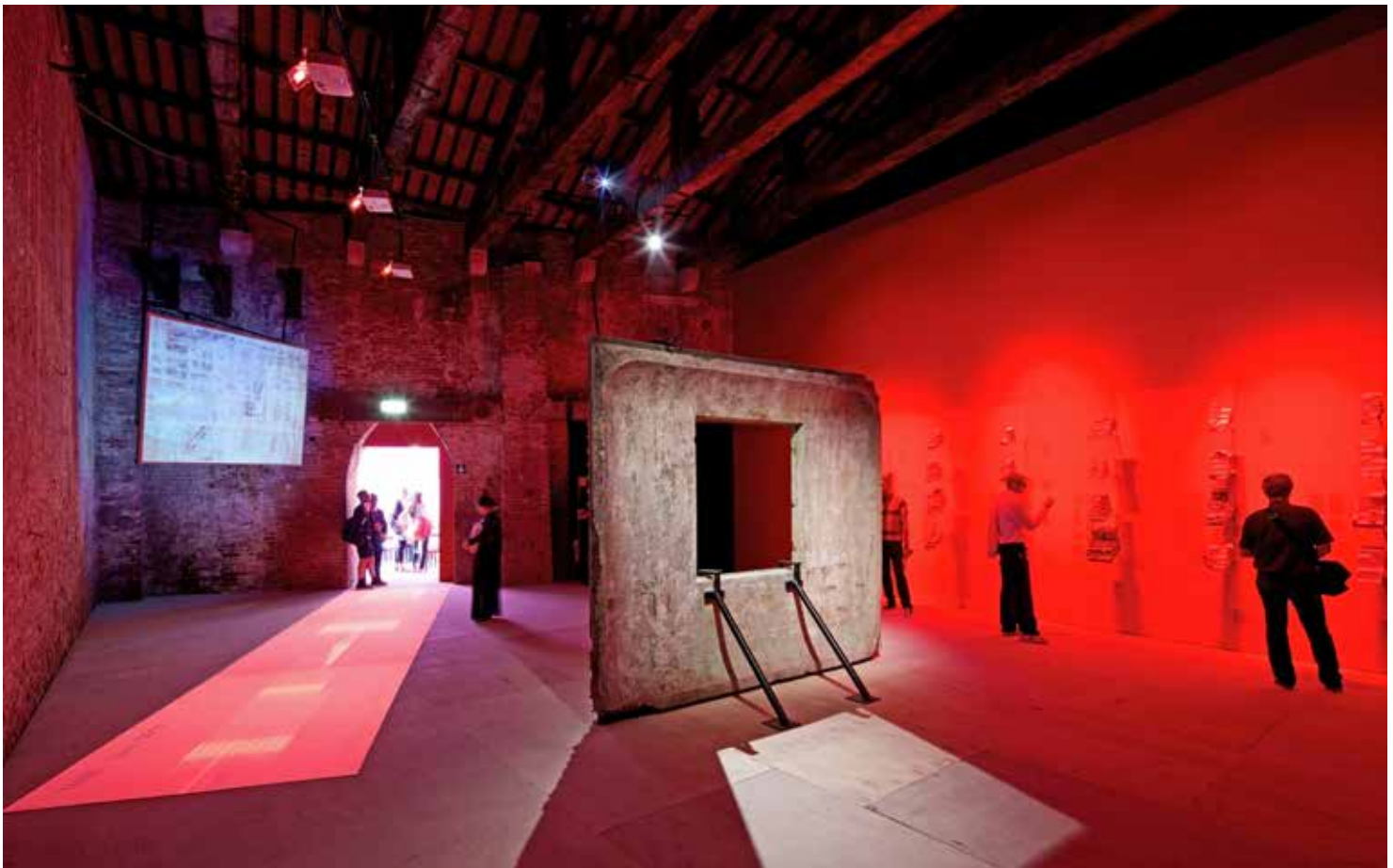
Panel en el Pabellón de Chile en la Bienal de Venecia, Italia, junio de 2014. The panel in the Chilean Pavilion at the Venice Biennale.