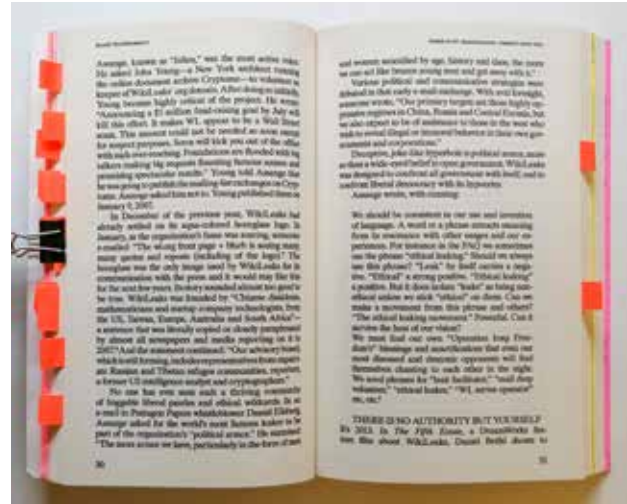
Metahaven. Black Transparency. The Right to Know in the Age of Mass Surveillance. Berlin: Sternberg Press, 2015. 30-31.

«WikiLeaks ha perdido gran parte de su blindaje político, incluso a pesar de que ha recuperado su capacidad para recibir y publicar documentos. Continúa desentrañando los circuitos del poder del estado moderno, pero: ¿dónde termina esto?, y ¿tiene algún fin? Probablemente no.»