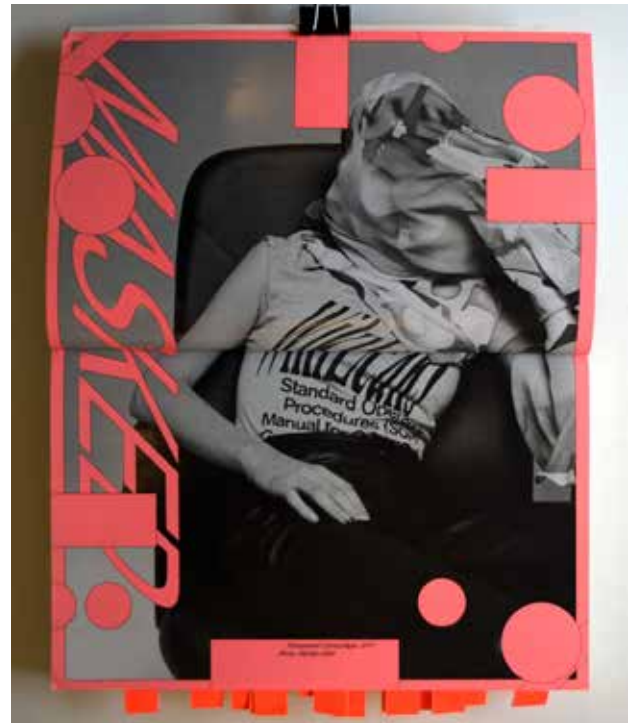
Transparent Camouflage , 2011. Metahaven. Black Transparency. The Right to Know in the Age of Mass Surveillance . Berlin: Sternberg Press, 2015.

Por último, se subentiende que la transparencia funciona en ambos sentidos: se puede ver y ser visto. Sin embargo, la 'transparencia negra' desencadena otra imagen: la transparencia unidireccional de las ventanas negras tipo espejo como las de una sala de interrogatorios. Ustedes han mencionado el concepto «caramelos de vidrio» como una ironía de las formas en que tanto los materiales como los discursos sobre la transparencia se utilizan justamente para evitarla (podemos ver lo que hay dentro de un banco, pero no podemos ver sus transacciones). Por eso me pregunto, ¿qué es lo que queda de la transparencia cuando es en realidad unidireccional? ¿Es sólo un panóptico? ¿O es acaso la ingenua 'transparencia literal', propuesta por Colin Rowe y Robert Slutzky (1963), la única opción que nos queda?