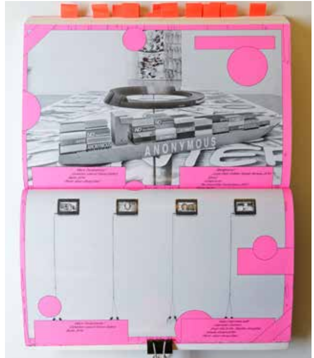
«Black Transparency. Exhibition view at Future Gallery» (Berlín, 2014). Metahaven. Black Transparency. The Right to Know in the Age of Mass Surveillance . Berlín: Sternberg Press, 2015.

Impotentes contra las redes de militantes extremistas, la decisión es criminalizar el uso del burka. Es una señal muy clara de que quienes toman las decisiones están completamente desorientados.