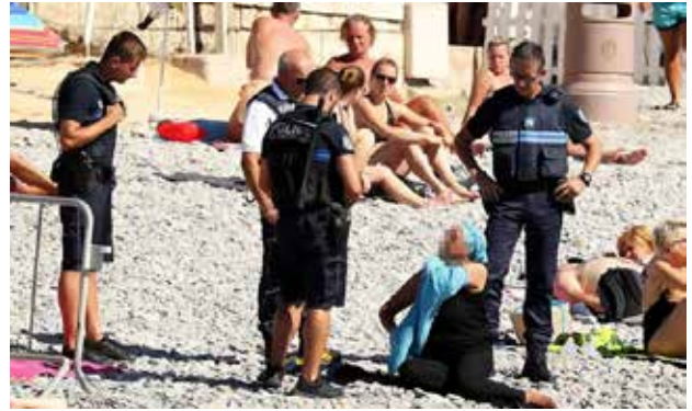
French police make woman remove clothing on Nice beach following burkini ban Fuente / Source: The Guardian . Londres: 24 de agosto de 2016. Disponible en: https://www.theguardian.com/world/2016/aug/24/french-police-make-woman-remove-burkini-on-nice-beach

La autoridad ética de la transparencia se perdió con la piratería y en la actualidad se reduce a una condición tecnológica objetiva, distribuida de forma desigual, a la que se le pueden adaptar propósitos ‘éticos’ e incluso utilizar como máscaras para objetivos que aún no están tan claros. ARQ