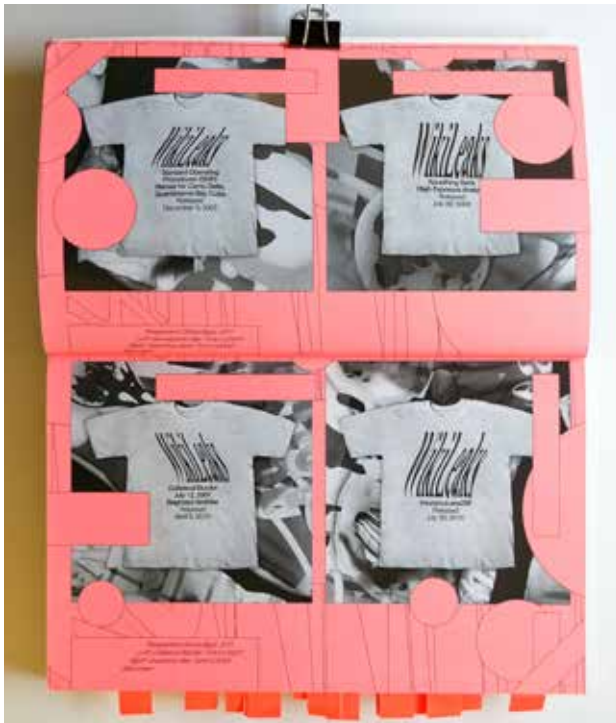
Transparent Camouflage , 2011. Metahaven. Black Transparency. The Right to Know in the Age of Mass Surveillance . Berlin: Sternberg Press, 2015.