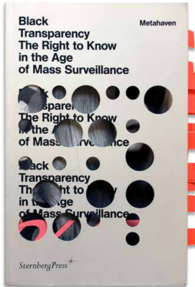
Metahaven. Black Transparency. The Right to Know in the Age of Mass Surveillance . Berlin: Sternberg Press, 2015. Portada / Cover.