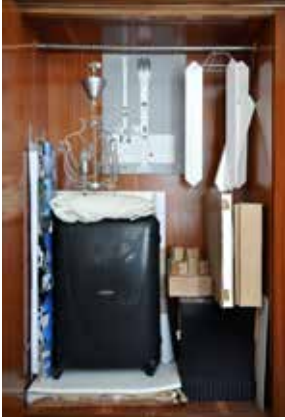
FIG 14 Material completo de Unfolding Pavilion almacenado al interior del guardarropa del dormitorio / The whole Unfolding Pavilion stacked inside of the bedroom's wardrobe