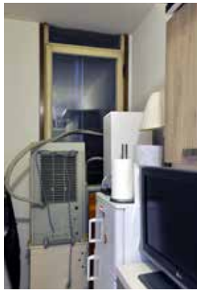
FIG 9 Cocina transformada en bodega / The kitchen transformed in warehouse.