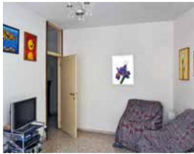
FIG 2 Sala de estar del departamento de la Casa alle Zattere / View of the living room of the apartment at the Casa alle Zattere.