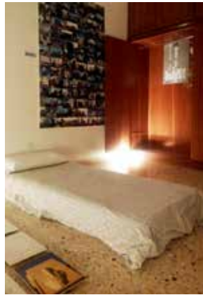
FIG 12 Dormitorio de noche, con un colchón en el piso, entre los trabajos exhibidos / The bedroom at night, with a mattress on the ground, among the exhibited works. © Davide Tommaso Ferrando