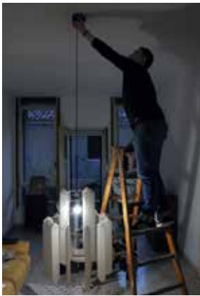
FIG 8 Montando la exhibición por primera vez / Mounting up the exhibition for the first time.