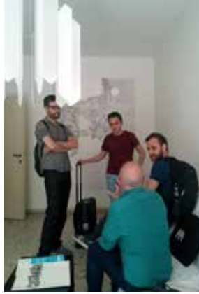
FIG 15 Encuentros casuales y debates informales en la habitación principal / Casual encounters and informal debates in the main room