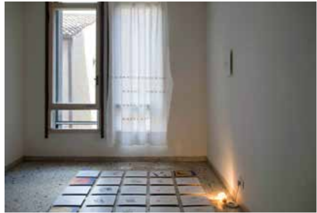
FIG 13 Vista del dormitorio / View of the bedroom. Adelante / Front: Daniel Tudor Munteanu (OfHouses), Face of the House. Atrás / Back: Volumetrica, Curtain

poco convencional de diferentes piezas de hardware de IKEA y Le Roy Merlin, conseguimos producir un conjunto original de las luces orientables que resultaron más económicas que las opciones similares más baratas disponibles en ambas tiendas (FIG. 13).