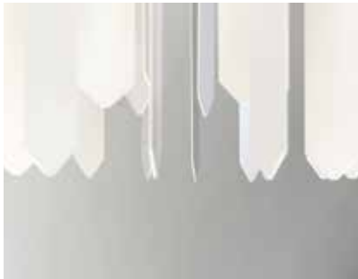
FIG 4 Davide Trabucco ( Confórmí ), Versus.