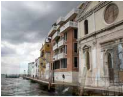
FIG 1 Vista de la Casa alle Zattere desde el vaporetto / View of the Casa alle Zattere from the vaporetto.