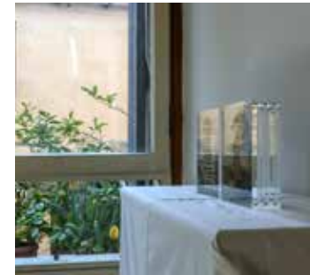
FIG 7 Luca Galofaro, Frammenti di un Atlante dell'Immaginazione (Fragments of an Atlas de la Imagination) / Fragments of an Atlas of Imagination .

y menos costosa de albergar una exposición que alquilar una galería. Por esta razón nos dirigimos a Airbnb en busca de los espacios domésticos que pudiesen ser convertidos temporalmente en lugares de exposición.