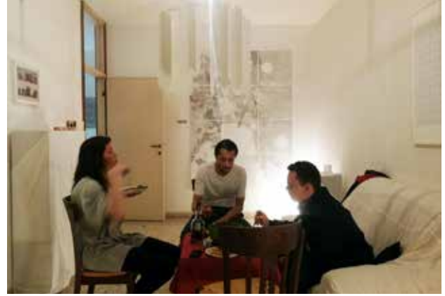
FIG 16 Cena de la noche final en la habitación principal del pabellón / Last night dining in the main room of the pavilion

para convertirlo en espacio de exposición y una cocina en una bodega. Hackeamos la experiencia de un pabellón en la experiencia de un hogar (FIG. 16). Hackeamos IKEA y Le Roy Merlin. Y al hacer todo esto, demostramos que hoy en día la posibilidad de curar una exposición está sólo a un paso, si es que uno tiene la capacidad de ampliar su imaginario hasta el punto en que las prácticas establecidas desaparecen, abriendo espacio a formas alternativas de disponer de la realidad. ARQ