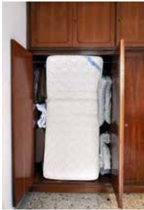
FIG 11 Colchones en el clóset del dormitorio / The mattresses in the bedroom wardrobe.