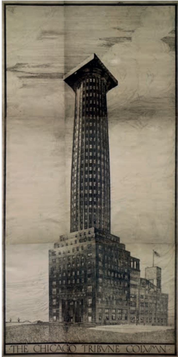
Adolf Loos. The Chicago Tribune Column. Vista / View. Chicago, 1922 © Albertina, Viena.