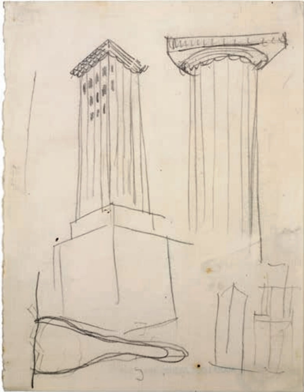
Adolf Loos. The Chicago Tribune Column. Esquemas / Sketches Chicago, 1922 © Albertina, Viena.