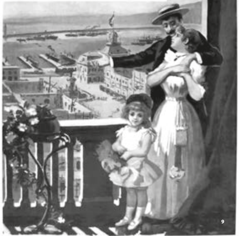
9 «De las Ruinas» "Fom Ruins." Fuente / Source: Zig Zag N° 82, 9 de septiembre de 1906. September 9, 1906.

La destrucción causada por el terremoto ha hecho resurgir de las ruinas el espíritu de Valparaíso una nueva ciudad, de edificios rectos, de calles anchas y confortables como en otros de su altura al borde de la gran altura y hermosos distribuidos la forma de un abanico, con un construcción digna y una que brilla al sol y producen sobre todo la fuerza y el orgullo. Al ver Valparaíso, comprendiendo nueva forma y nueva vida, levantados de sus cenizas como el ave Fénix y reorganizados por la gracia de sus edificios, por su belleza y todos los puntos de la distancia en la costa del Pacífico. En el fondo, se habían creado nuevos signos característicos marcando los valores que forman la esencia y la grandeza a grandes rasgos. Allí se ven los otros aspectos que luego tiempo han sido apreciados como un mundo nuevo, como dicen que se veja, como realidad imposible. Contemplando esta hermosa pintura escríbame a la construcción de un pueblo que se levanta sobre de ruinas antiguas, como el espíritu de un pueblo resucitado y moderno, y un orgullo que viene porvenir prometido como otros años más tarde. El artículo da noticia del una intervención, sobre a una organización que se cobra momentos un patrimonio de todos los que son, entonces bajo la influencia de un sentimiento noble. Es que se ha dado en hacer algo que parece. Resucitar en la desgracia un orgullo sobre la humanidad y dar salida de un documento que muestra sus hijos de experimentos.