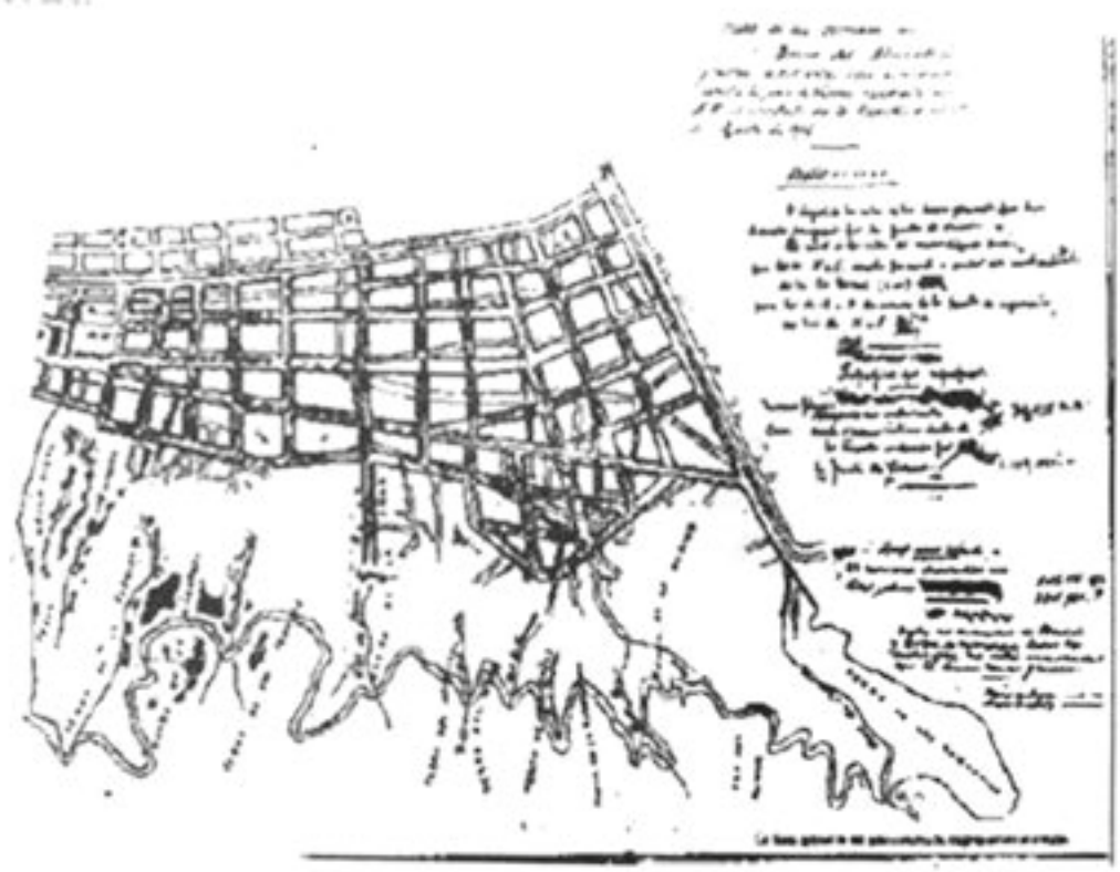
5 Propuesta de la cgv. Plano de F. Garnham y J. Lyon. / cgv proposal. Plan by F. Garnham and J. Lyon.