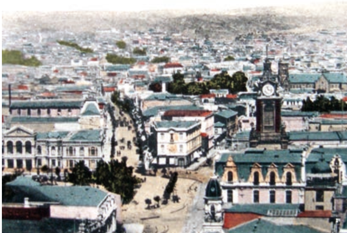
1 El Almendral antes del terremoto de 1906. Calle y Plaza Victoria, Valparaíso. (Actual Av. Pedro Montt). / El Almendral before the 1906 earthquake. Victoria Street and Square, Valparaíso. (Current Pedro Montt Av).

está definido de manera explícita, así como tampoco lo están los valores particulares asociados a ella. Sin embargo, hay momentos en que el valor de un bien peculiar debe ser discutido o incluso disputado. Por ejemplo, valoramos una reliquia familiar cuando se ha perdido o un humedal cuando alguien lo ha contaminado. En estos casos, es la destrucción de un objeto o un lugar lo que hace evidente que ha perdido valor y su restitución pasa por definir qué, cómo y en cuánto se valora lo perdido.