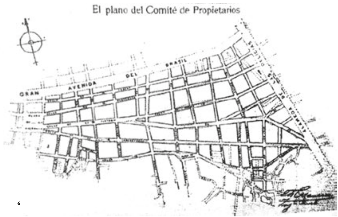
6 Propuesta del Comité de Propietarios. Plano de C. Claussen. Landowners' proposal. Plan by A. Bertrand.