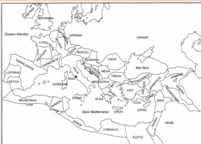
El Imperio Romano en su período de máxima expansión territorial, a fines del reinado de Trajano (117 d.C.)