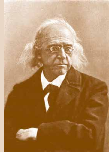
Mommsen: Premio Nobel de Literatura (1902).

No quisiera finalizar estas breves reflexiones conmemorativas de Theodor Mommsen sin antes mencionar dos grandes intuiciones casi proféticas o mejor dicho proyecciones de la inteligencia histórica del maestro a partir de sus estudios académicos, de sus escritos, de su vida política y de su aguda