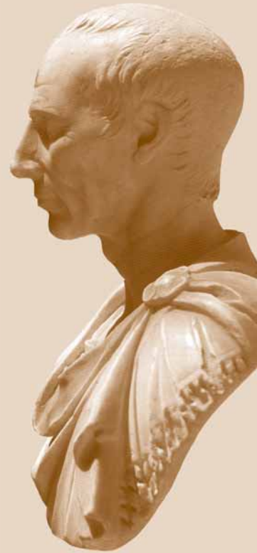
Julio César: genio político y creador del imperio, según Mommsen.