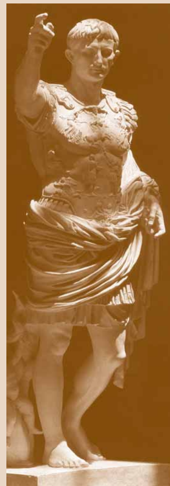
Octavio Augusto: primer emperador romano (27 a.C. - 14 d.C.)

Historia, epigrafía y, en fin, derecho fueron el tríptico que, constante y regularmente, jamás abandonó Mommsen en sus 60 años de productividad sostenida. De sus obras jurídicas predomina el Römisches Staatsrecht , Derecho público romano , su obra científica-jurídica por excelencia, el gran tratado de derecho constitucional y administrativo romano publicada entre 1871 y 1888 en tres volúmenes. Asimismo, confeccionó una edición del Digesto , un gran estudio sobre el Derecho civil romano y otro del Derecho penal romano en 1899. Se interesó en profundizar la problemática de las fuentes del derecho y en poder diferenciar la institución política romana republicana e imperial. Visualizó a Octavio Augusto en su nuevo modelo y régimen imperial como una diarquía 5 donde gobernaban simultáneamente el princeps y el