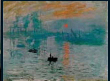
C. Monet, "Impresión, sol naciente"