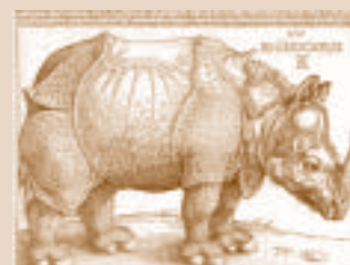
Rinoceronte, de Dürero