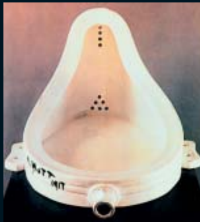
M. Duchamp, "La fuente"