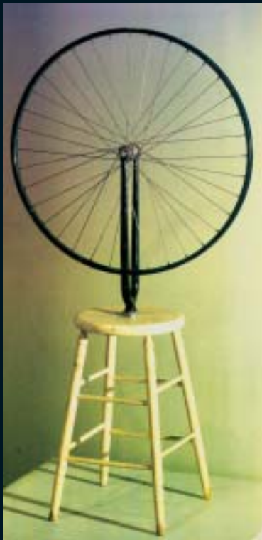
M. Duchamp, "Rueda sobre un taburete"