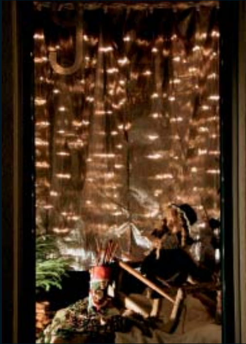
J. Tinguely, "Barras"