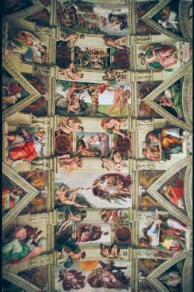
Miguel Angel, "Capilla Sixtina"