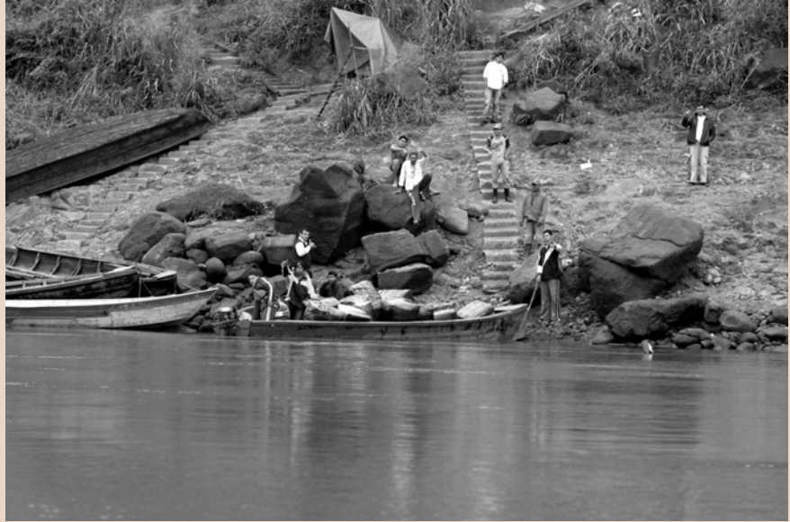
Figura 3. Puerto clandestino en el barrio San Miguel, Ciudad del Este.

lado brasileño, a ciertas horas del día, controlando a quienes atraviesan el viaducto a pie, o en automóvil, con una carga excesiva y evidente. Nadie presta atención a los caminantes discretos o a los motoristas, que pasan por miles (literalmente) a cada hora, transportando pasajeros y/o cargas desde Foz de Iguazú a Ciudad del Este y viceversa, en un trayecto que no toma más de 15 minutos. De noche, cualquier peatón o vehículo (de dos o cuatro ruedas, descontando camiones y vehículos pesados) puede circular libremente –con o sin carga 9 . Pero, si la permeabilidad del paso fronterizo formalmente habilitado preocupa, la realidad de los pasos informales realmente sorprende. Los puertos clandestinos pululan en las orillas del Paraná (río que marca el límite entre Brasil y Paraguay), funcionando a vista y paciencia de las autoridades (brasileñas y paraguayas) que nada hacen por controlar el tráfico fluvial irregular. Gran parte del contrabando pasa actualmente –de un país al otro– a través del río, y por las aguas del embalse de la represa de Itaipú (a 14 kilómetros al norte del Puente de la Amistad) (Colmán et al. , 2008; 2009).