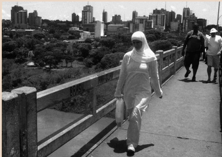
Figura 2. Mujer libanesa en la frontera entre Brasil y Paraguay.

que parte de los dineros que se envían a Medio Oriente llegan a manos del grupo fundamentalista Hezbolá (grupo chiíta libanés), y a otros grupos, movimientos o partidos implicados en actos violentos y terroristas (como Hamas y supuestamente al-Qaeda). De este hecho derivan las tesis –propugnadas por algunos académicos, agencias de inteligencia y periodistas (fortalecidas luego de los atentados del 2001 contra el World Trade Center de Nueva York, y el Pentágono en Washington)– que sostienen que desde la Triple Frontera se financia en buena cuenta el terrorismo islámico (muchas veces –se dice– con ganancias generadas ilícitamente), y sugieren que en la zona existen “células terroristas dormidas” a la espera de instrucciones para entrar en acción.