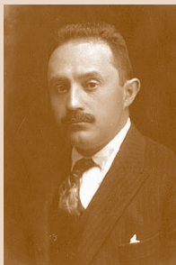
J. de Vasconcelos

Florece una generación que tiene derecho a llamarse nueva, no sólo por sus años, sino más legítimamente porque está inspirada en estética distinta de la de sus antecesores inmediatos, en credo ideal que la crítica a su tiempo calificará con acierto, pero que no es ni romántico ni modernista ni mucho menos positivista o realista, sino una manera de misticismo fundado en la belleza, una tendencia a buscar claridades inefables y significaciones eternas. No es fe platónica en la inmortalidad de las ideas, sino algo muy distinto, noción de la afinidad y el ritmo de una eterna y divina sustancia (Vasconcelos, 1911).