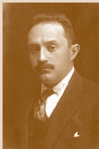
J. de Vasconcelos

Florece una generación que tiene derecho a llamarse nueva, no sólo por sus años, sino más legítimamente porque está inspirada en estética distinta de la de sus antecesores inmediatos, en credo ideal que la crítica a su tiempo calificará con acierto, pero que no es ni romántico ni modernista ni mucho menos positivista o realista, sino una manera de misticismo fundado en la belleza, una tendencia a buscar claridades inefables y significaciones eternas. No es fe platónica en la inmortalidad de las ideas, sino algo muy distinto, noción de la afinidad y el ritmo de una eterna y divina sustancia (Vasconcelos, 1911).