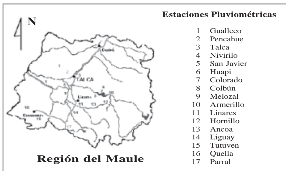
Figura 1. Mapa de ubicación de la Región del Maule. Location map of the Maule region of Chile.

Selección de las estaciones pluviométricas: la selección de las estaciones se realizó de acuerdo a los siguientes criterios: