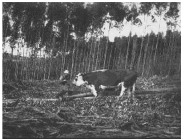
Figura 1. Extracción de trozas largas de Eucalyptus globulus en cosecha a tala rasa.

Oxen logging in tree-length system in Eucalyptus globulus clear-cut.