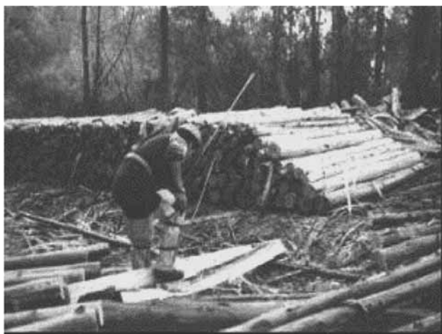
Figura 2. Descortezado manual a orilla de camino de trozas de Eucalyptus globulus .

Debarking with Hand-tools in pulp logs at roadside in Eucalyptus globulus clear-cut.