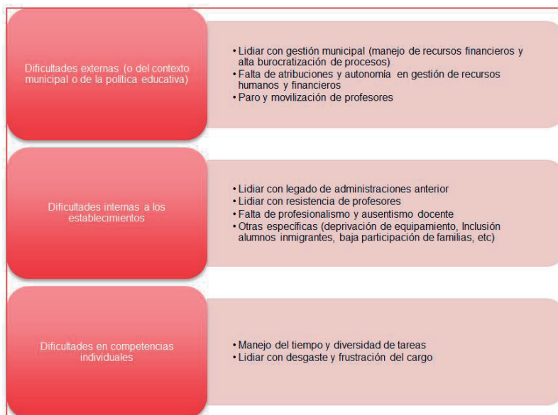
Cuadro 4. Sistematización de dificultades centrales enfrentadas por área