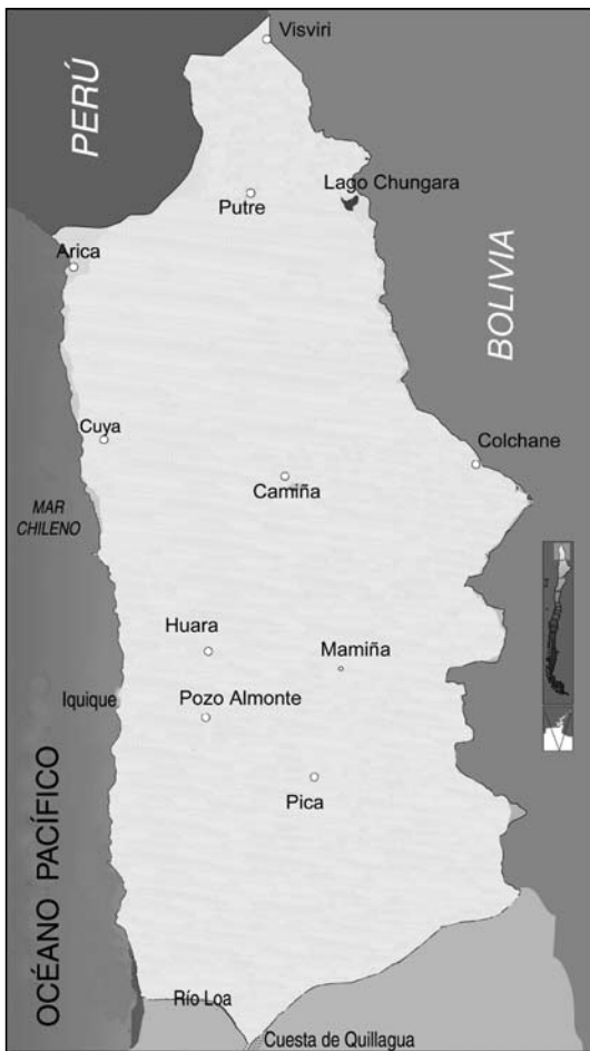
Figura 1. Mapa de la zona estudiada y localidades de las fiestas patronales más inclusivas.

Map of the studied zone and locations of the 'fiestas patronales' more inclusive.