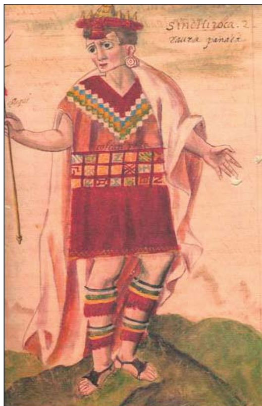
Figura 2. Camiseta colcampata en el Códice Murúa 2004 [1590]:10.

Un caso diferente y notable se presenta en don Pedro Arapa (Qulla), no solo por la riqueza y abundancia de su ajuar, sino por los detalles de su inventario donde se describen más de 25 vestidos en cumbi o abasca señalados en pares (mantas y camisetas) con sus respectivos colores y diseños, dando a entender que cada uno de esos pares de prendas tenía un uso ceremonial específico 26 (Tabla 3).