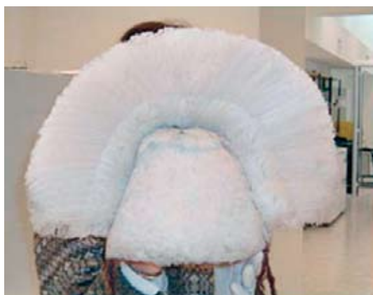
Figura 6. Sombrero de plumas. Museo Arqueológico de Alta Montaña, Salta.

Feathered hat. Museo Arqueológico de Alta Montaña, Salta.