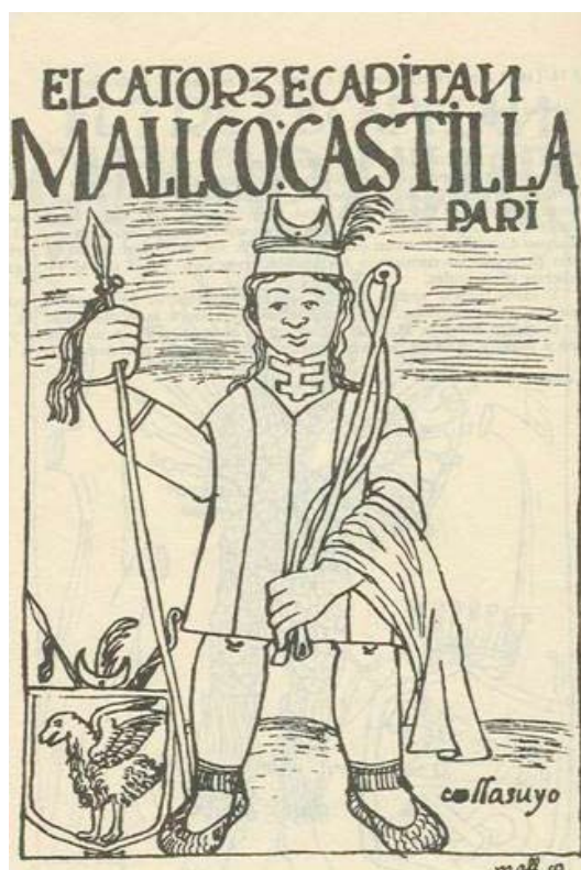
Figura 5. Capitán del Qullasuyu. Felipe Guaman Poma 1980 [1615/16], editado por J. Murra y R. Adorno, p. 148. Captain of the Qullasuyu . Felipe Guaman Poma 1980 [1615/16], edited by J. Murra and R. Adorno, p. 148.

En los inventarios de los caciques se describe cantidad de objetos en oro y plata y el adorno más difundido fueron las chipanas o brazaletes, aunque también tenían orejeras, anillos, macanas con filos de plata, torzales de plata para las hachas y trompetas del mismo metal (derechas o con vueltas) de uso ceremonial (Tabla 4) 27 . El cacique Quta de anansaya usaba en su frente pillos o coronas de oro mientras que el de urinsaya los usaba de plata. En cambio, el caciques Qulla colgaba unas puntas de plata en sus pillos ( pinxes ) o de oro en su sombrero ( chokcho ). Es interesante destacar que los Quta usaban unas medias lunas de oro o plata ( paure, pariri ) con un complemento del mismo metal en la barbilla. En los dibujos de Guaman Poma las medias lunas aparecen adosadas a los pillos o