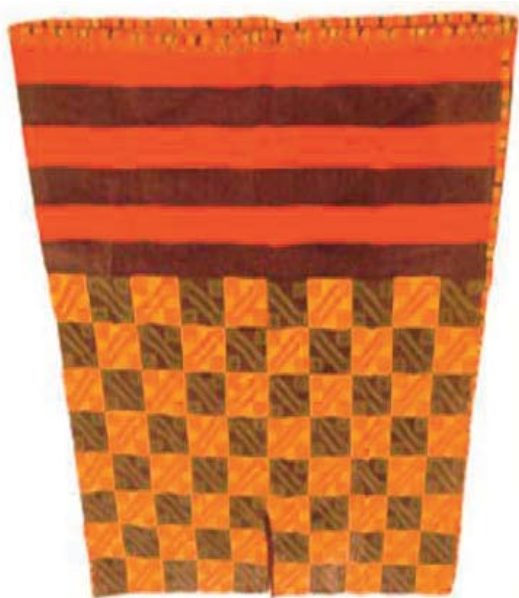
Figura 3. Camiseta (Museo de Arqueología de Alta Montaña, Salta).

Los objetos de oro y plata también estaban vinculados al tiempo del inka, sobre todo asociados a los mitos de origen de los gobernantes (unión del sol y de la luna), el oro al culto solar mientras que