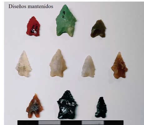
Figura 3. Puntas de proyectil: diseños mantenidos.

el espesor de la base, pero en el espesor de la raíz, la máxima dispersión y máximos valores se encuentran en CN (Tabla 5). No se observaron diferencias interareales en los valores promedio (Tabla 5).