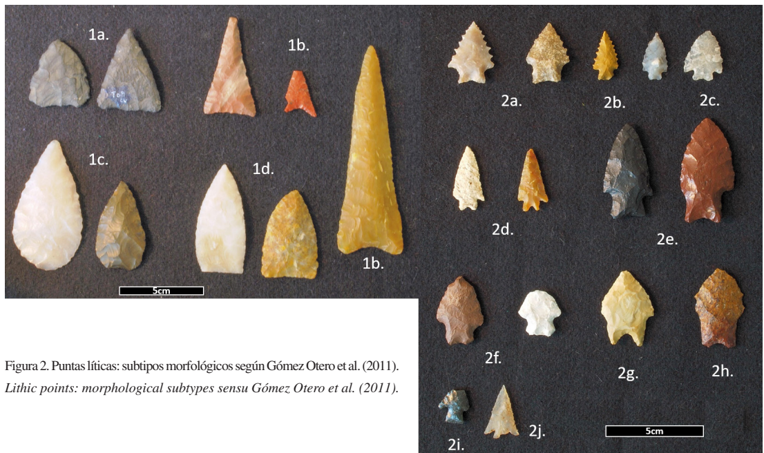
Figura 2. Puntas líticas: subtipos morfológicos según Gómez Otero et al. (2011). Lithic points: morphological subtypes sensu Gómez Otero et al. (2011).

extremo meridional de Patagonia. La muestra incluyó ejemplares de 4.000 a 200 años AP provenientes de dos áreas: (a) entre puerto San Julián (49°S) y el estrecho de Magallanes (52°S), y (b) el nordeste de Chubut. Si bien se identificaron leves variaciones morfométricas entre las distintas latitudes, estas puntas comparten varios atributos: el ancho y espesor de la raíz, la longitud, el ancho y el espesor del pedúnculo y la razón entre el espesor de la raíz y el espesor del limbo. En este caso, las del nordeste de Chubut (Figura 2:2e-2f) se diferencian por presentar un pedúnculo un poco más angosto. Sobre la base del trabajo de Bettinger y Eerkens (1999), se postuló la existencia de una única población o diseño exitoso que fue replicándose a lo largo de más de tres mil años (Franco et al. 2010). En síntesis, ambos estudios señalan alta variabilidad en diseños y tamaños para el noreste de Chubut, lo que podría vincularse con cambios a través del tiempo, con el uso de diferentes sistemas de armas o técnicas de caza y/o con contactos intrarregionales e interregionales de antigua data (Gómez Otero et al. 2011).