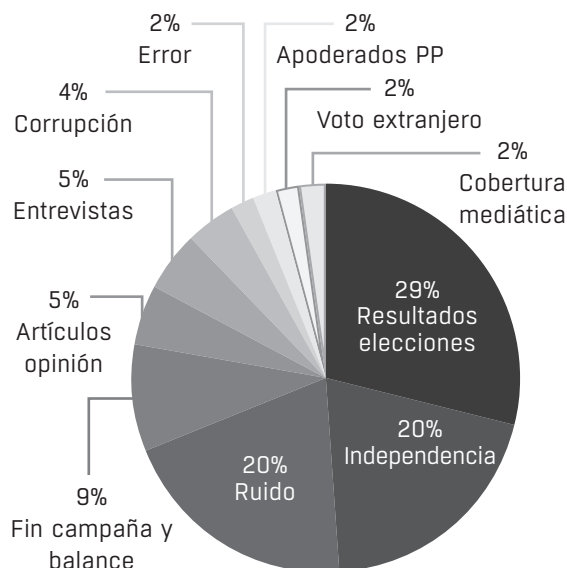
Gráfico 2. Temas de los enlaces de medios de comunicación en el #25N