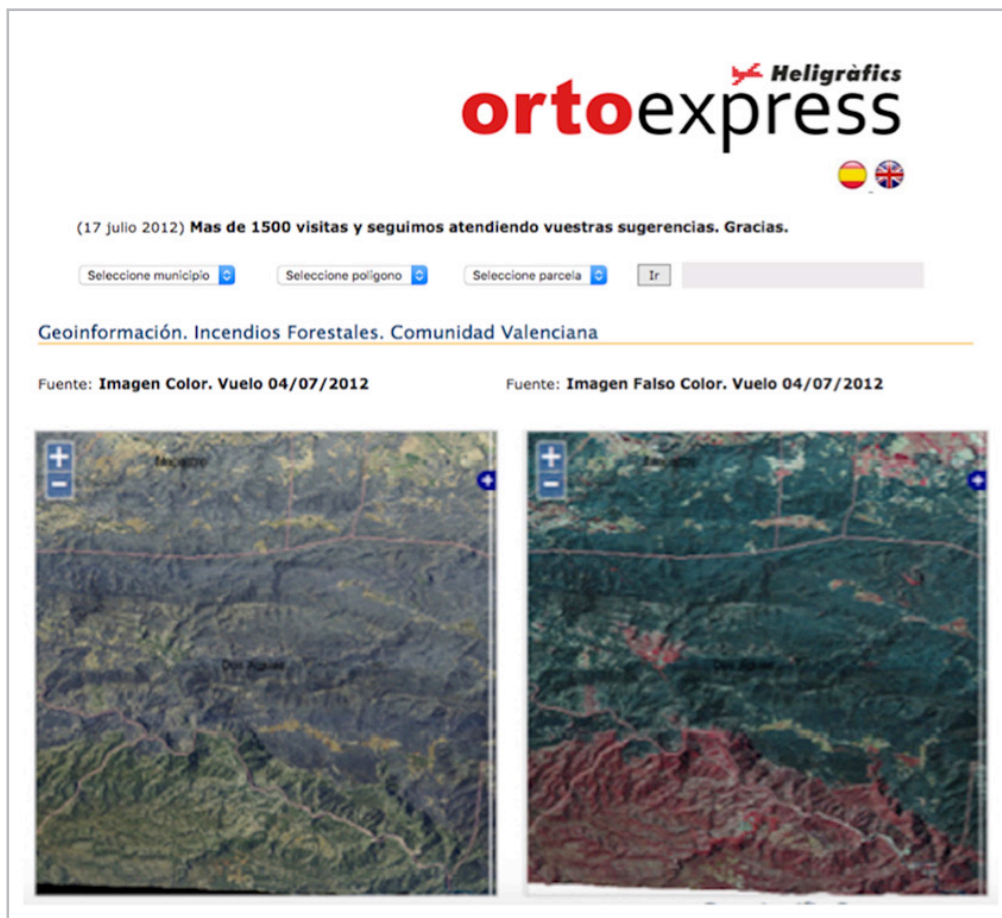
Figura 2. Ejemplo de enlace propuesto por un usuario experto

Por su parte, las empresas remiten a sus webs, pero también a blogs de expertos. Los usuarios catalogados como profesionales/expertos, entre ellos, profesores, ingenieros o publicistas, recomiendan a especialistas y voces alternativas en el 80% de las ocasiones. Así se aprecia en la figura 2, que recoge unas imágenes sobre las dimensiones de los incendios de Valencia, enlazadas desde la web de una empresa especializada en fotogrametría. Esta sugerencia parte de un usuario englobado en la categoría profesionales/expertos. Por su parte, los colectivos ciudadanos proponen contenidos de medios en el 25% de los casos. También dirigen el tráfico a blogs y otras redes sociales. En el supuesto de los incendios, que cuenta con presencia de colectivos vinculados al activismo político, estos colectivos promocionan sus webs y las páginas de partidos políticos.