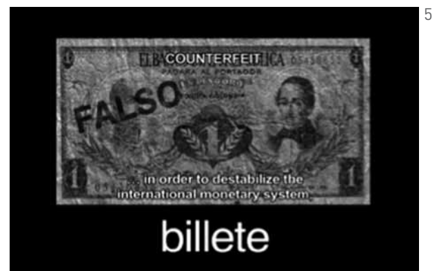
Figura 5: Metáfora compuesta por billete y escritura, relativa también a la propia naturaleza Un tigre de papel .

Del mismo modo como el personaje falso es una metáfora de nosotros, muchos contenidos de una gran parte del discurso son falsificaciones o alusiones a la falsificación, a tono metafórico con el personaje y con el falso documental que es Un tigre :