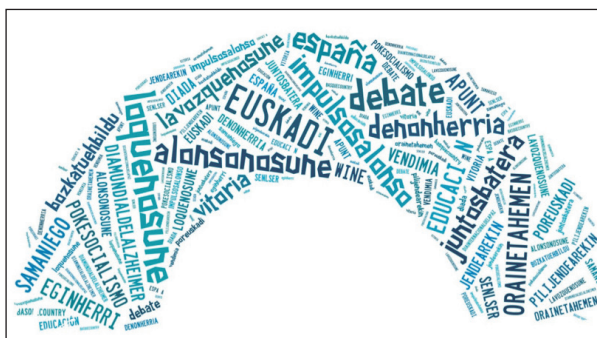
Figura 3: Etiquetas más utilizadas en los tuits de los candidatos vascos