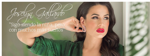
Imagen 1. Portada de Facebook de Revista Hogar (julio 13, 2017)

En la imagen 2, que representa a una de las portadas analizadas de la revista COSAS , se puede observar que el texto que acompaña a la foto de una mujer sexualmente bella es " Sigo siendo la niña, pero con muchos más sueños ". De acuerdo a la RAE, la definición de niño/a se dice de una persona que no es un niño: que obra con poca reflexión o con ingenuidad o es una mujer que no ha perdido la virginidad. En este caso, el significado tradicional de niña tampoco coincide con lo que se pretende comunicar. La presencia de una mujer cosificada sexualmente se evidencia a través de la sugerencia de erotismo a través del comportamiento sexual (mirada sexual y lenguaje corporal) y del atractivo físico (nivel de belleza de su rostro, su cabello, su físico y en general su complexión). La correspondencia entre significante-significado-referente de la frase que acompaña a la imagen hace que el lector de dicha portada infiera un significado incomparable al tradicional, lo que realza la deformación de la imagen femenina.