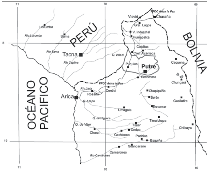
Figura 4. Ubicación y deslindes (línea gris) de la “Comunidad Juan de Dios Aranda” (Cartografía esquemática).

considere que por medio de este arrendamiento este individuo modifique la actitud que ha tenido hasta ahora y se consiguiera su ayuda efectiva.