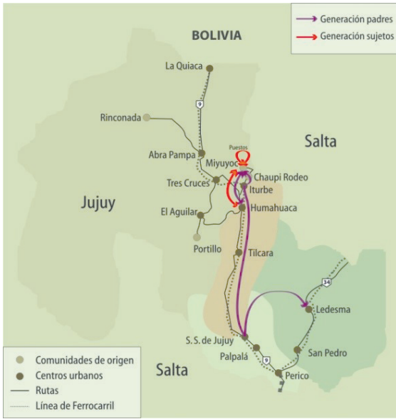
Figura 1. Movilidad durante la etapa de reproducción campesina (1940-1960).