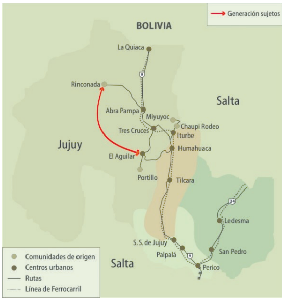
Figura 3. Movilidad durante la etapa de reproducción en la mina (1970-1990).