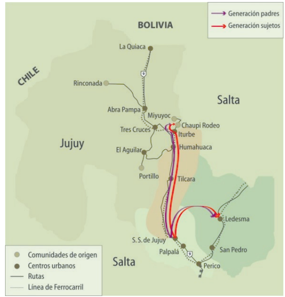
Figura 2. Movilidad durante la etapa de reproducción en la zafra (1960-1970).