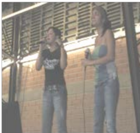
Concierto de hip hop “Tejiendo redes de solidaridad” Universidad de Antioquia (2011)

la imagen masculinizada del hopper se relaciona con contextos de violencia armada, donde la dimensión masculina tiene un protagonismo central. Esa imagen ha sido estereotipada por la publicidad y las industrias culturales, al poner en circulación en el mercado, ante todo, a hombres jóvenes rodeados de confort y consumo, acompañados de una mujer dispuesta al sexo; esa imagen invisibiliza el rol de la mujer en el mundo hopper. Sería necesario revisar la imagen de mujer hopper; que difunden los medios masivos de comunicación, pues generaliza un cuerpo femenino dispuesto para la sexualidad y el consumo” (Ibíd).