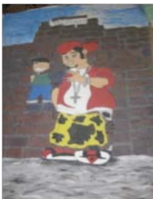
Fotografía de Esquema 3. B 24 MURALES

A continuación se da cuenta a través del ejercicio fotoetnográfico y la lectura iconográfica lo que representa para los investigados y la investigadora el trabajo sobre el mural. La fotografía, su descripción, la voz de los jóvenes escolares, la de la investigadora, la emergencia de categorías y focos que amplían la lectura sobre la observación y permiten la construcción de la narrativa.