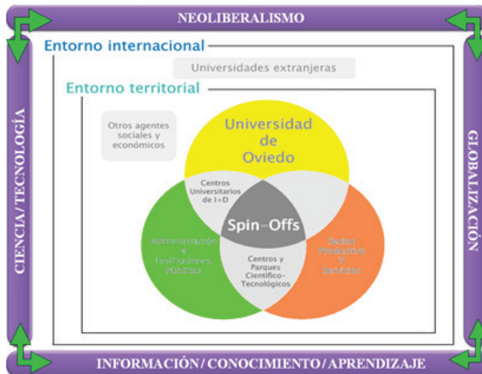
Figura 3. La Universidad de Oviedo desde una perspectiva ecosistémica. Estrategia AdFuturum

Esta iniciativa (figura, 3) ha sido avalada con diferentes reconocimientos pero a medida que pasa el tiempo los detractores se han ido incrementando argumentando que la estrategia no estuvo bien diseñada al querer desplegarse muchas iniciativas simultáneamente, nunca se dispuso de la financiación necesaria, los plazos de ejecución han estado más vinculados a los intereses de los promotores que a las necesidades reales, el modelo de gobernanza no ha sido adecuado para gestionarlo adecuadamente y la sensación de desarraigo ha calando en aquellos sectores que han quedado desplazados de los clústeres estratégicos (Álvarez Arregui y Rodríguez Martín, 2012a).