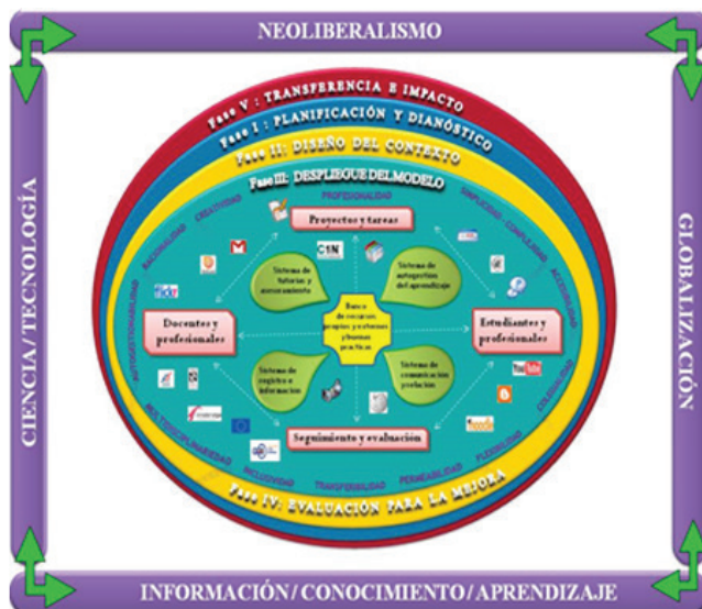
Figura 4. EcosistemaP. Un ecoentorno de formación para aprender a emprender en la Universidad del siglo XXI

El modelo se inspira en las organizaciones que aprenden (Senge, 1990) destacando como principios básicos de su diseño y funcionamiento la racionalidad; la flexibilidad, la permeabilidad, la colegialidad; la profesionalidad, la multidisciplinariedad, la autogestionabilidad, la creatividad, la inclusividad, la transferibilidad y la complejidad optimizando los recursos docentes disponibles y adecuando las modalidades de enseñanza necesarias a un entorno de aprendizaje globalizado. EcosistemaP se perfecciona constantemente, es decir, es capaz de descubrir nuevas ideas, de integrarlas y de transformarlas orientándolas hacia sus objetivos, es decir, tiene capacidad de aprender, de mejorar y quiere crecer dentro y fuera de la institución que le sirve de referencia. El diseño básico es el siguiente (figura 4).