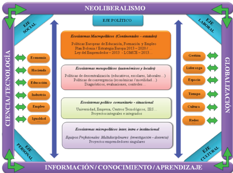
Figura 1. Continente y referentes de las instituciones educativas en el siglo XXI. Escenario simplificado

En el eje político se convierte así en el eje que arbitra soluciones entre las partes implicadas adoptando un enfoque sistémico como única alternativa viable para dar respuestas a las demandas de una sociedad compleja y global. Bajo este planteamiento los organismos internacionales desarrollan diagnósticos generales desde los que se construyen visiones globales que son adoptadas por los gobiernos como guías de referencia para articular sus