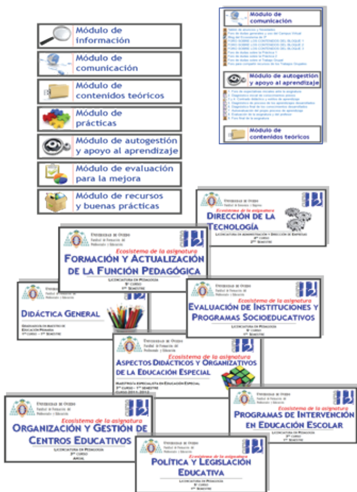
Figura 5. Imágenes de módulos del Campus Virtual y asignaturas participantes en el ecosistema

A manera de ejemplificación presentamos los módulos básicos con los que trabajamos de manera habitual en asignaturas de la Licenciatura en Pedagogía, del Grado de Pedagogía, del Grado de Maestro y en distintos másteres (ver figura 5). La estructura es la siguiente: