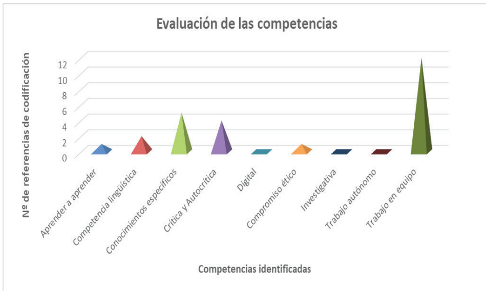
Gráfico 2. Número de referencias de codificación sobre la Evaluación de las Competencias