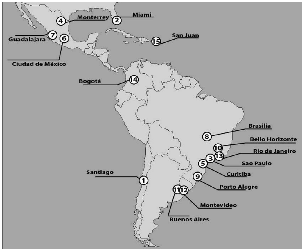
Figura 1. Ranking 2004 de las mejores ciudades para hacer negocios en Latinoamérica, en base a datos de América Economía .

Por último, un ranking muy relevante es el que construye Mercer (MHRC), el que si bien no tiene por objetivo directo medir la competitividad de las ciudades sino la calidad de vida en ellas, cobra importancia dado que cada vez con mayor fuerza es utilizado por las empresas –e incluso por los países– para determinar sus proyectos de inversión transnacionales. Este ranking se construye en función del costo de vivir en cada ciudad, para lo que ha agrupado una serie compleja de indicadores en cua-