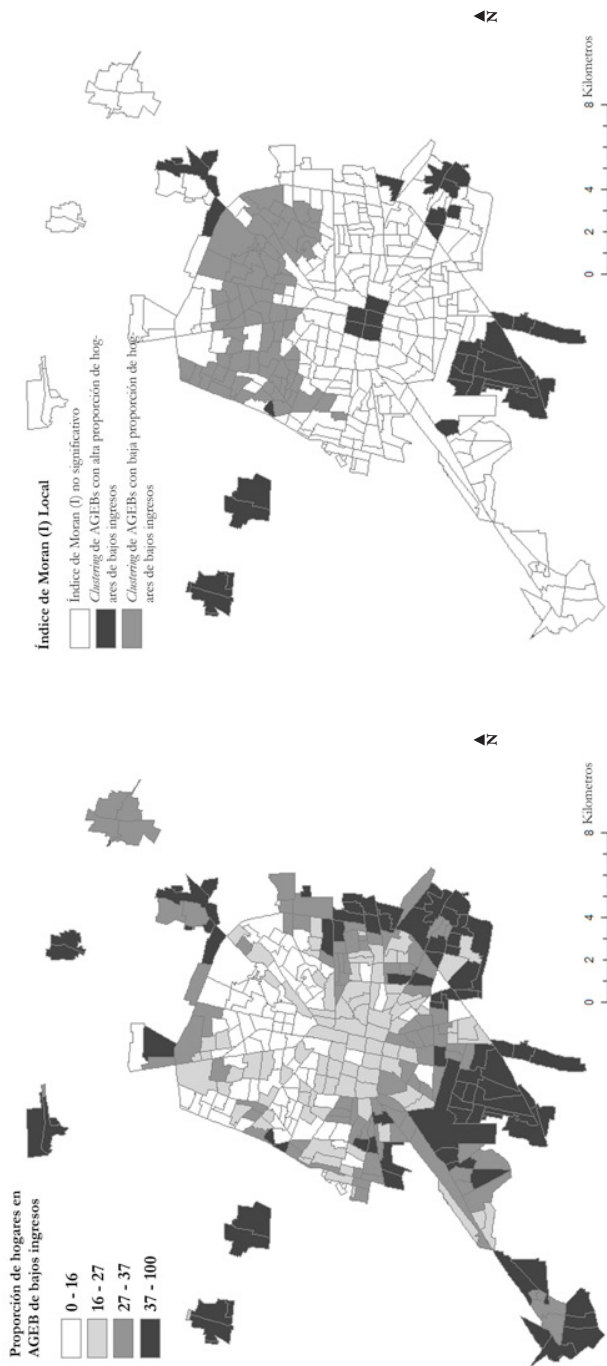
FIGURA 2 | Mapa de coropletas de Mérida, Yucatán, que muestra la proporción y agrupamiento de los hogares de bajos ingresos por AGEB, 2000