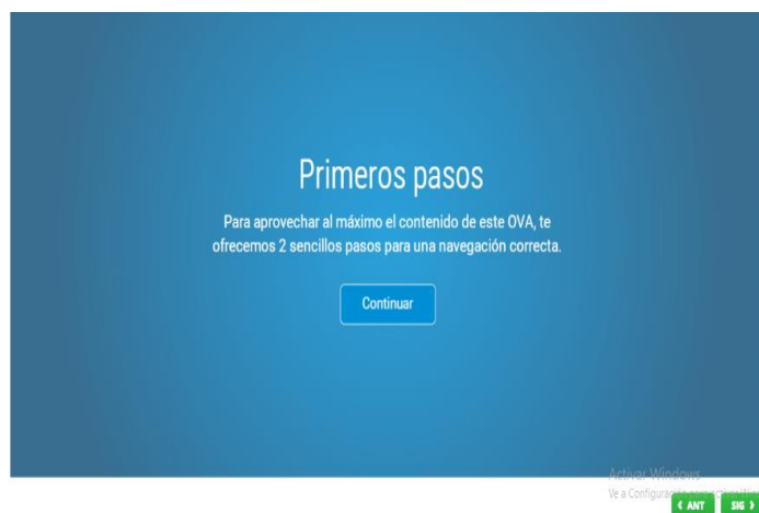
Fig.3: Página de inicio de acceso a los contenidos del OVA de Calculo Diferencial

Inicio (título del OVA, descripción del OVA, indicadores de desempeño, indicaciones de navegación). Objetivos (objetivo de la temática). Contenidos (temas del OVA navegados de manera interactiva bajo formatos multimedia (hipertexto, audio, videos), sub temas (hipertexto, audio, videos) con navegación con navegación tanto lineal como por panel de navegación. Actividades de aprendizaje y evaluativas (actividades de apropiación de la temática, actividades evaluativas interactivas, retroalimentación inmediata, opciones para volver a desarrollar la actividad). En las figuras 3 y 4, se muestra ventanas de acceso a los OVA.