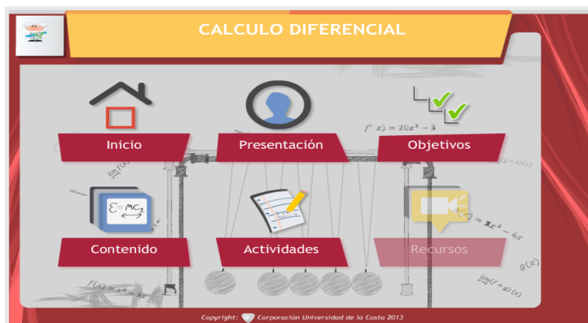
Fig.2: Página de acceso a un OVA de Calculo Diferencial

cual se procedió a crear los contenidos de refuerzo que fueron puestos a disposición de los estudiantes. En la figura 2, se muestra la página de ingreso a uno de los OVA desarrollados en la asignatura de cálculo diferencial, durante el trabajo de investigación.