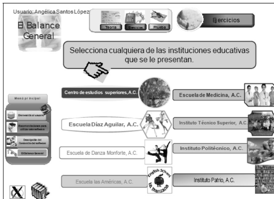
Fig. 3: Pantalla de módulos de la sección de ejercicios del software educativo de balance general aplicado a instituciones educativas.

No todos los software educativos que se ofrecen en el mercado de forma gratuita o no, se pueden adaptar a la enseñanza de las distintas áreas en temas específicos, como sucedió en el caso de la asignatura de Conceptos Contables y Financieros en el Ámbito Educativo, donde se requiere ajustar la teoría y los ejercicios elaborados para empresas comercializadoras y de fabricación, al proceso contable de las instituciones educativas. Esa adaptación, dependerá de las características del alumno y de su campo de actuación, por lo que el profesor, asumirá el rol de diseñador, de aquel software educativo que incluya los contenidos que se necesiten para el usuario al que está dirigido.