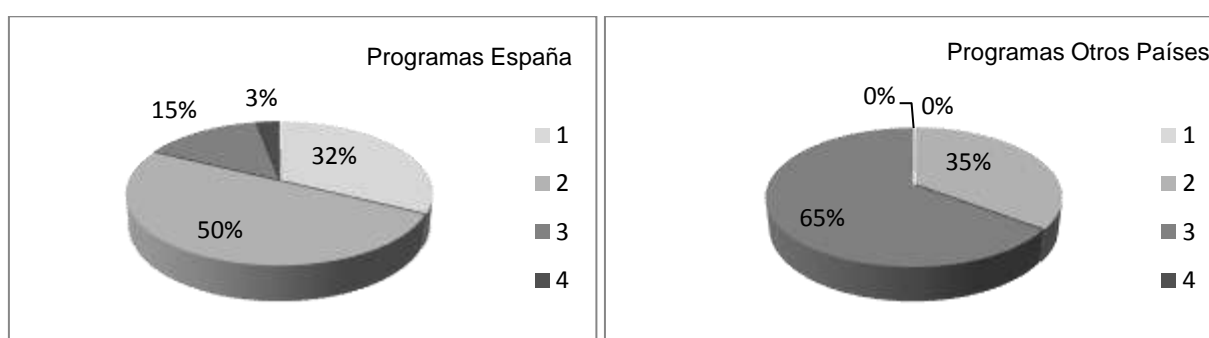
Fig. 1. Porcentaje de webs según el atractivo de su diseño (1 = "muy poco atractiva", 2 = "poco atractiva" 3 = "atractiva" y 4 = "muy atractiva")

El diseño es uno de los primeros aspectos que invita al usuario a permanecer en la página web. Este es el factor más valorado por los internautas a la hora de decidir sobre la elección de un servicio a través de la web. Un bonito diseño da sensación de seguridad (Robins y Holmes, 2008) ya que parece que la web ha sido más trabajada también en otros aspectos (seguridad, uso de nuevas técnicas, etc). Los resultados del análisis del diseño (Figura 1) revelan que el 81% de de los programas españoles tienen webs con diseño poco o muy poco atractivo y tan sólo un 19% tienen una web atractiva o muy atractiva, lo que refleja que es un aspecto poco cuidado a la hora de difundir la información. En las web de otros países, el 65% se han clasificado como atractivas y el 35% como poco atractivas. La mayoría son páginas web con un diseño muy elaborado (mayor variedad de colores, fotografías dinámicas, formato pantalla completa) que invitan al usuario a seguir navegando por la web.