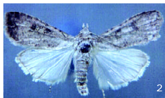
FIGURA 2. Adulto de H. polymorpha Forbes.