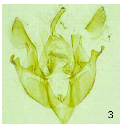
FIGURA 3. Genitalia del macho de H. conchidia Butler.