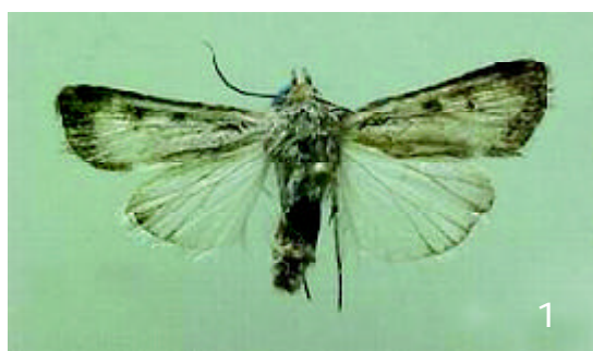
FIGURA 1. Adulto de H. conchidia Butler.