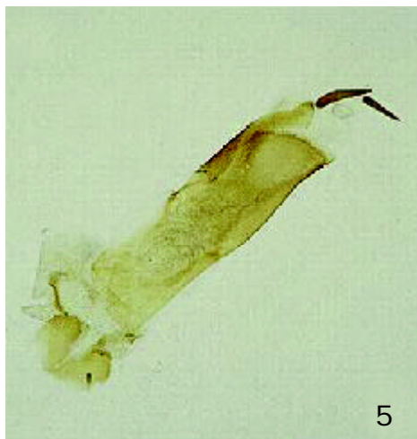
FIGURA 5. Aedeagus de H. conchidia Butler.