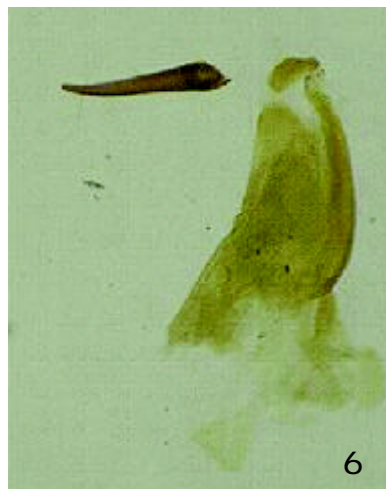
FIGURA 6. Aedeagus de H. polymorpha Forbes.