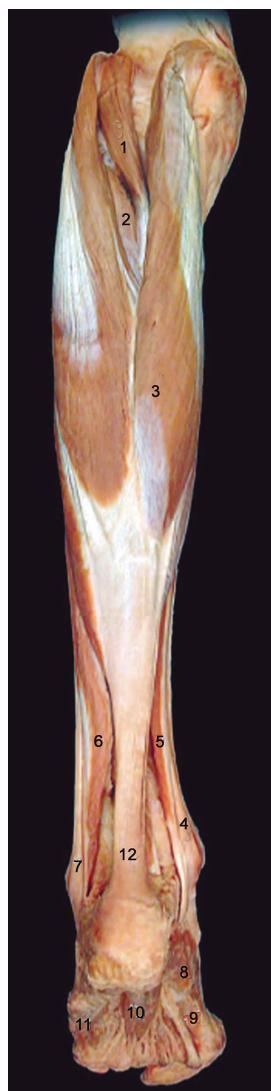
Fig. 1. Visión posterior y superficial de la pierna. 1. M. plantar; 2. M. tibial posterior; 3. M. gastrocnemio; 4. M. flexor largo de los dedos; 5. M. flexor largo del hállux; 6. M. sóleo; 7. Tendón fibular largo; 8. M. abductor del hállux; 9. M. flexor corto del hállux; 10. M. flexor corto de los dedos; 11. M. abductor dedo mínimo.

Los textos anatómicos clásicos (Testut & Latarjet, 1979; Rouvière & Delmas, 2000) describen al músculo plantar con sus orígenes en el cóndilo lateral del fémur y sus inserciones calcáneas. Estudios en series ratifican esta descripción indicando que el tendón se dirige hacia inferomedial entre el músculo gastrocnemio y el músculo sóleo; su inserción puede ser en el tendón calcáneo o en otro sitio de la superficie medial del hueso calcáneo (Feneis & Dauber, 2000; Kwinter et al. , 2010); también se mencionan muchas variaciones en toda su morfología: dobles músculos plantares unilaterales (Kwinter et al. ) doble origen e inserción única (Soni et al. , 2014) ausencias en porcentajes variables (Testut, 1884; Venter