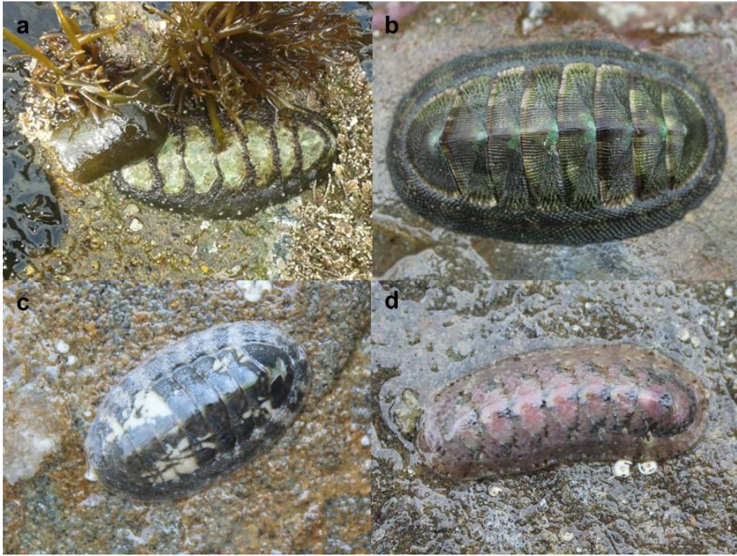
Figura 2. Fotografías de los quitones más abundantes en la zona de estudio, a) Acanthopleura echinata , Lobitos, Perú, b) Chiton stokesii , Santa Rosa, Ecuador, c) Ischnochiton dispar , Santa Rosa, Ecuador, d) Stenoplax limaciformis , Santa Rosa, Ecuador.