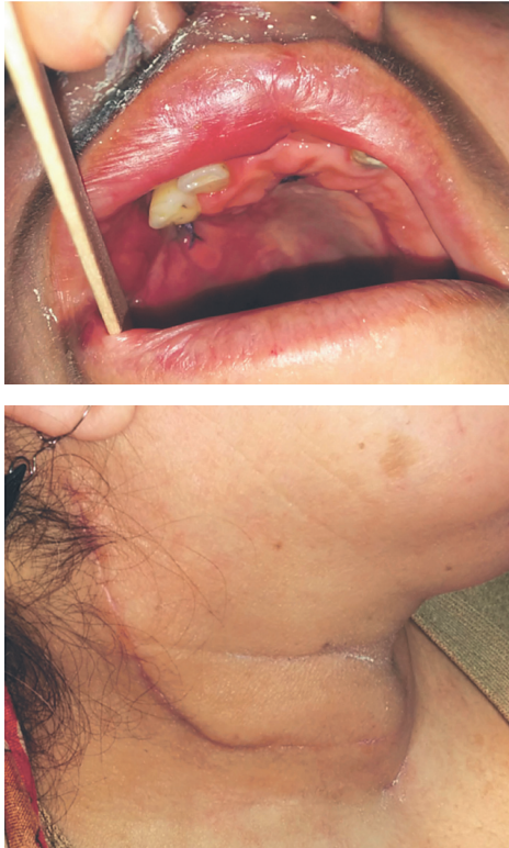
Figura 2. Imágenes posteriores a maxilectomía parcial y vaciamiento cervical.

habitual, tales como un examen visual acucioso de todas las áreas de la mucosa oral, con el fin de propender a un diagnóstico precoz de lesiones potencialmente malignas y su tratamiento oportuno, con el fin de brindar un mejor pronóstico y calidad de vida para los pacientes afectados.