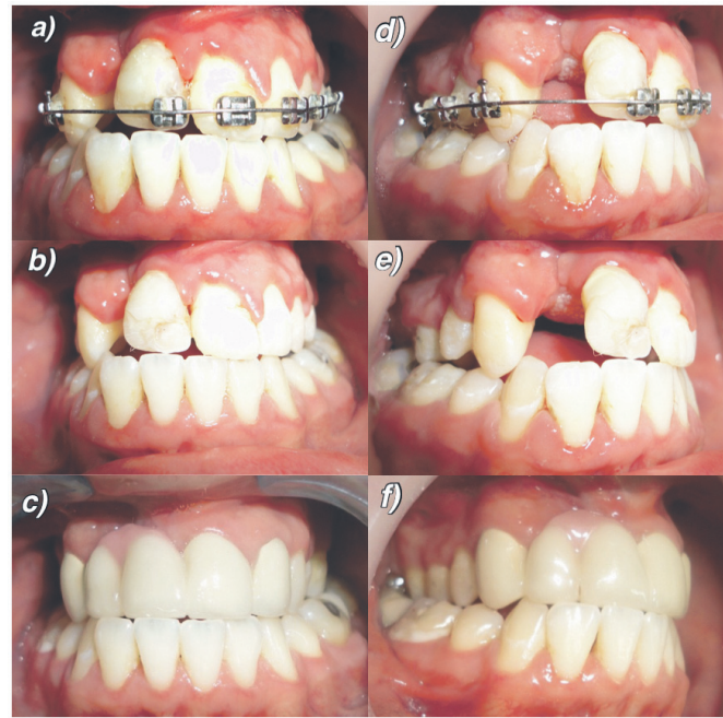
Figura 2. Fotografías frontales de arcadas en oclusión (a-c). Fotografías laterales derechas de arcadas en oclusión (d-f). Paciente durante tratamiento de ortodoncia con aparatología fija. b. Paciente al terminar tratamiento de ortodoncia. c. Paciente al finalizar tratamiento rehabilitador mediante prótesis fija plural con pilares en piezas 1.3,2.1 y 2.2, para rehabilitar piezas 1.1 y 1.2. Nótese además porcelana rosada para mejorar la falta de contorno gingival en relación a la fisura.

Se realiza interconsulta a Cirugía Plástica para la evaluación del cierre de la fístula y coordinar el inicio del tratamiento de ortodoncia. Este último