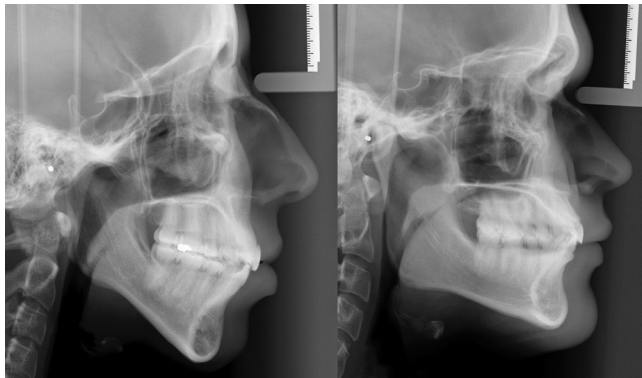
Figura 2. Telerradiografías de perfil de un individuo braquifacial (izquierda) y un dolicofacial (derecha).

estudio para no influenciar sus respuestas.