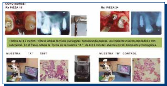
Figura 3. Al cuarto mes dos muestras de tejido óseo se tomaron antes de colocar los implantes de 4.3 x 10mm.

Previamente a la colocación mediante el empleo de una trefina de 3mm de diámetro y 15mm de longitud, se realizaron dos biopsias de tejido alveolar de la pieza 15, Muestra "A" rellena previamente con sulfato de calcio hemihidratado y de la pieza 24, Muestra "B" sin relleno para el estudio histológico e histomorfométrico en el Servicio de Patología y Cirugía Oral de la Universidad Peruana Cayetano Heredia.