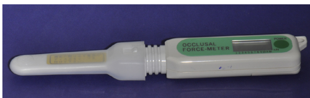
Figura 2 Dispositivo hidráulico digital GM10.

presencia de ambos apellidos de origen indígena. Por el contrario, la clasificación de los individuos no indígenas se realizó por la ausencia de ambos de sus apellidos de origen mapuche. Estos datos fueron recolectados durante una encuesta en la anamnesis.