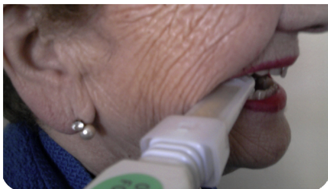
Figura 1 Imagen meramente esquemática del posicionamiento del dispositivo en boca con su respectiva cubierta higienizable.