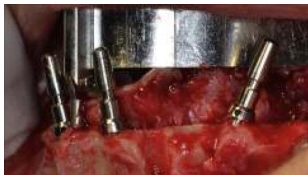
Figura 2 Cirugía de implantes maxilar inferior.

Por las características clínicas de la paciente, y ya que no desea someterse a cirugía reconstructiva más compleja, se planifica prótesis híbrida maxilar y mandibular. Para ello es necesaria la elevación bilateral de los senos maxilares. En el mismo tiempo quirúrgico se instalan 8 implantes Zimmer® TSV 3,7 × 13 (Zimmer Dental, Carlsbad, EE. UU.), en ubicación lateral posterior con relleno de la premaxila. Esto permite la distribución poligonal de las cargas, evita la instalación de implantes anteriores y mejora el ajuste protésico a ese nivel. Para el maxilar inferior se planifica técnica quirúrgica Revitalize (fig. 2). Teniendo en consideración que uno de los objetivos quirúrgicos en la instalación de los implantes es lograr estabilidad primaria compatible con la carga inmediata, esta se mide con el