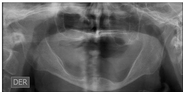
Figura 1 Radiografía panorámica inicial.

disminuir la calidad de las estructuras y extender los tiempo de confección 7,10 .