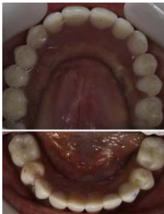
Figura 9 Vista oclusal de prótesis híbridas.

de forma y superficie de implantes han hecho de la elevación del seno maxilar una técnica de cirugía reconstructiva muy predecible. Debido a esto, la lateralización de los implantes, evitando su instalación en la zona de la premaxila ha mejorado el resultado protésico desde el punto de vista estético y funcional (disminución de seseo, filtración de aire y mejora de la adaptación de la prótesis al sector anterior).