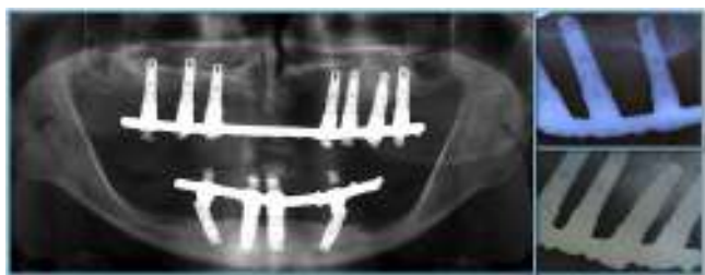
Figura 6 Control radiográfico subestructuras Cr-Co.