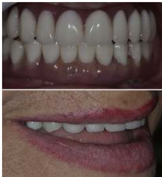
Figura 8 Prótesis híbridas terminadas.

En relación con la prótesis híbrida del maxilar superior, es necesario destacar que el desarrollo y la evolución de biomateriales, manejo de ingeniería tisular e ingeniería