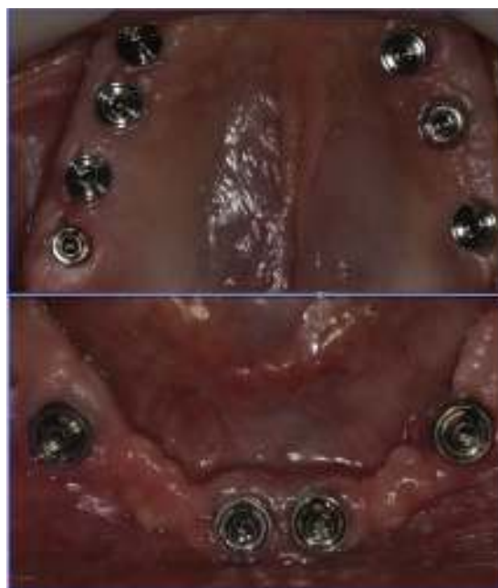
Figura 3 Implantes conectados mediante pilares cónicos.

dinamómetro del motor quirúrgico, confirmando un troque progresivo que no alcanza los 40 N y en la medición con el ISQ® (Ostel ISQ) se alcanza una medición de solo 40 ISQ. Esto determina que los implantes queden sumergidos por un período mínimo de 2 meses, tiempo durante el cual la propiedad osteoinductiva de la superficie micro-texturizada del implante (MTX®) transformará la estabilidad mecánica en estabilidad biológica o secundaria.