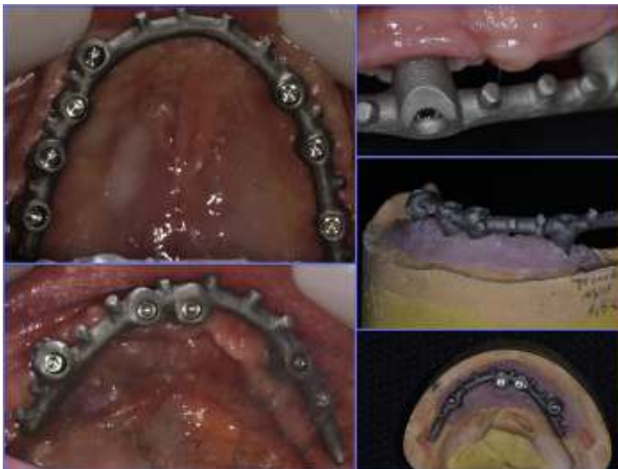
Figura 5 Subestructuras para prótesis híbridas realizadas en aleación Cr-Co mediante sinterizado láser.

de las subestructuras metálicas para las rehabilitaciones protésicas (fig. 4), utilizando como referencia las prótesis transitorias, respetando así los espacios protésicos necesarios y obtener, de esta manera, una rehabilitación funcional y estética. Las subestructuras diseñadas se confeccionaron mediante sinterizado láser, lo que permitió controlar de forma precisa el diseño de los socavados y perlas de retención para acrílico (fig. 5). La prueba de las barras en boca muestra un ajuste pasivo de estas, lo que se corrobora con la