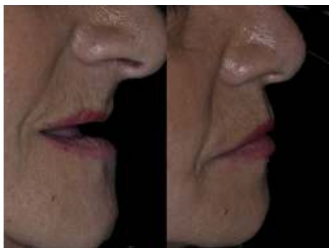
Figura 7 Fotos de perfil con y sin prótesis híbridas.

toma de radiografías panorámica y periapicales, observando el correcto asentamiento protésico tanto maxilar como mandibular (fig. 6). Una vez verificado el ajuste pasivo de las subestructuras, se continúa con la confección de las prótesis híbridas, con el recubrimiento acrílico de las barras, logrando resultados satisfactorios, tanto funcionales como estéticos, al devolver el soporte labial y reponer los elementos dentarios perdidos (figs. 7 y 8). Una vez finalizadas las prótesis estas se torquean a 15 N y se sellan las chimeneas con teflón y resina compuesta (Permaflow Pink®, Ultradent Walladent y Amellogen Plus®, Ultradent Walladent, EE. UU.) (fig. 9).